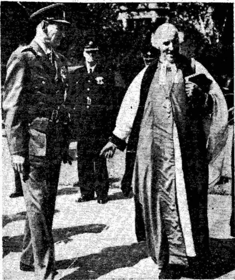
Garsusis taikos čempionas Konterburio dekanas Dr. H. Johnson priima Danijos karalių Fredericką, kurs vizituoja Angliją. Jis užsuko pamatyti garsiąją katedrą, kurios galva yra Dr. Johnson.

Ponams bus sunku išsisukti. Komunistų valdomos ša-