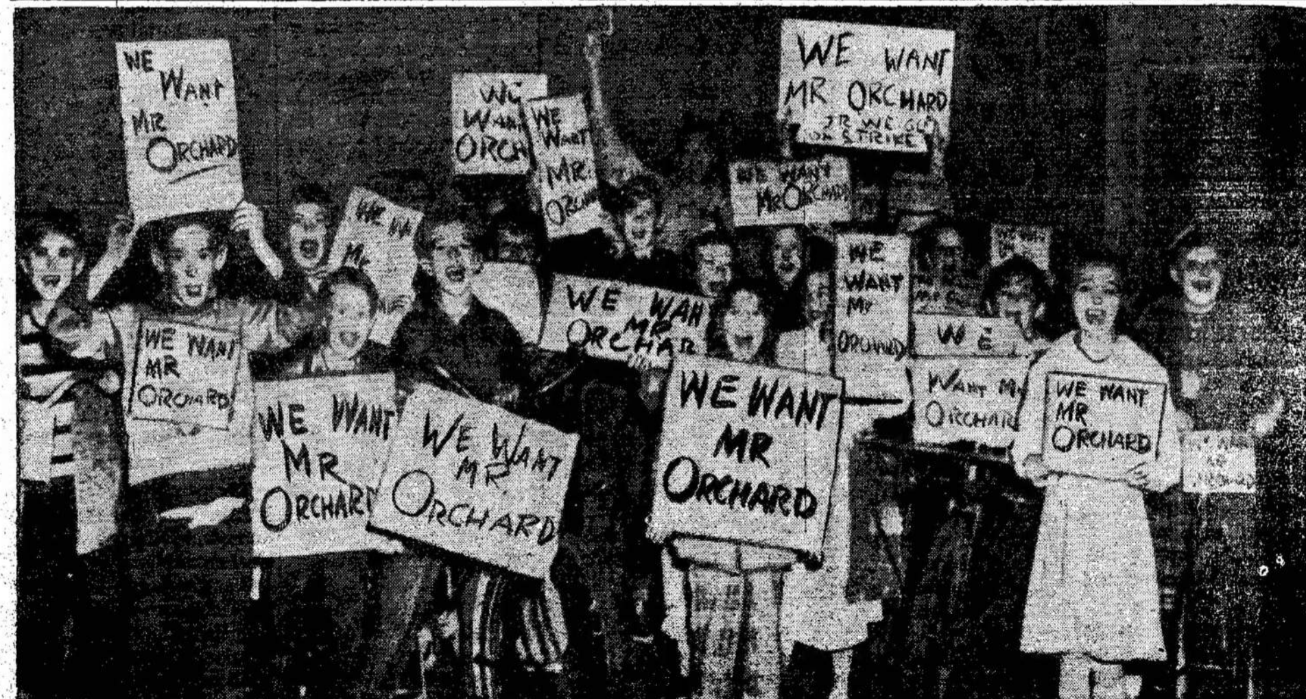
Vittoria miestelio (kelios mylios nuo Simcoe) mokyklos taryba buvo pasimojusi

Jei Norite Žinoti, Kas Tikrai Dedasi Pasauly, Škaitykit Liaudies Balsą