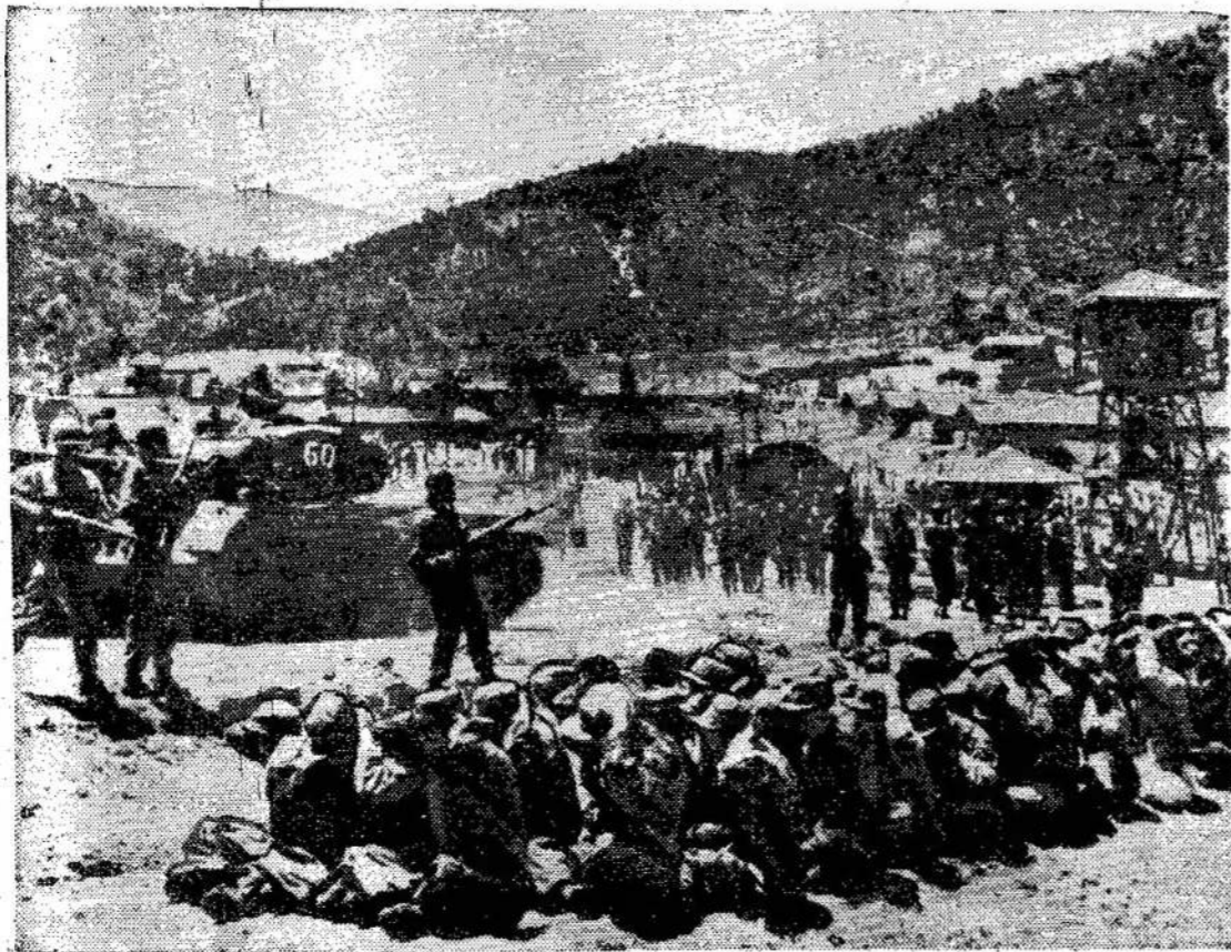
Scena iš kovų tarp belaisvių ir amerikiečių ant Koje salos. 31 korėjiečių buvo užmuštas ir dar daugiau sužeistas. Amerikiečiai naudojo ugniasvydžius ir kitas priemones. Belaisviai kovojo pagaliais ir savo darbo durtuvais.