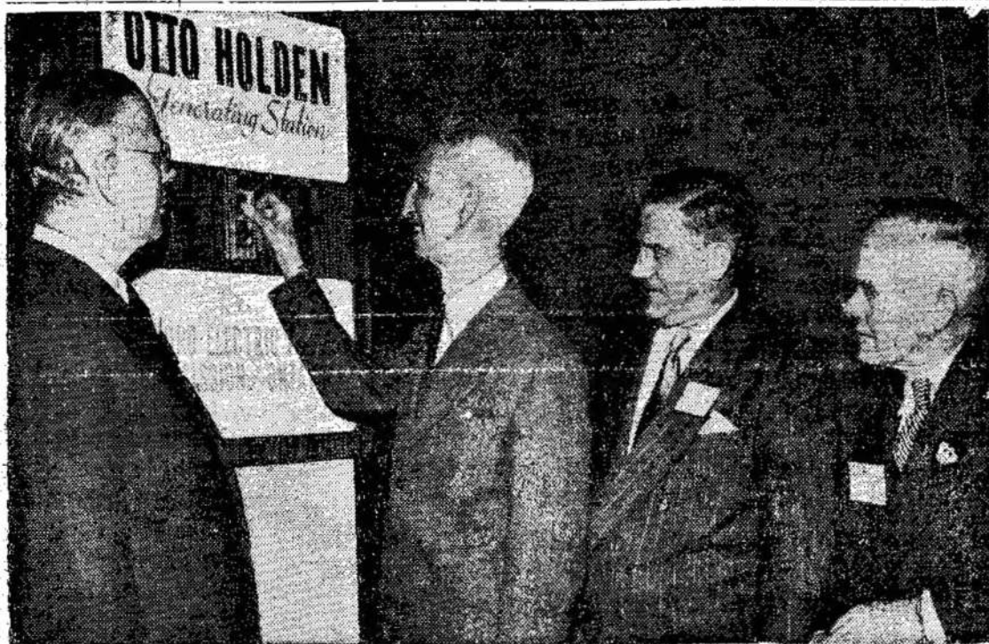
Ant Ottawa upės, ties La Cave, neseniai buvo atidaryta nauja hidroelektrinė, kainavusi $60,000,000. Šioj nuotraukoj matote ceremonijas laike atidarymo elektrinės.

Jei Norite Žinoti, Kas Tikrai Dedasi Pasaulį, Skaitykit Liaudies Balsą