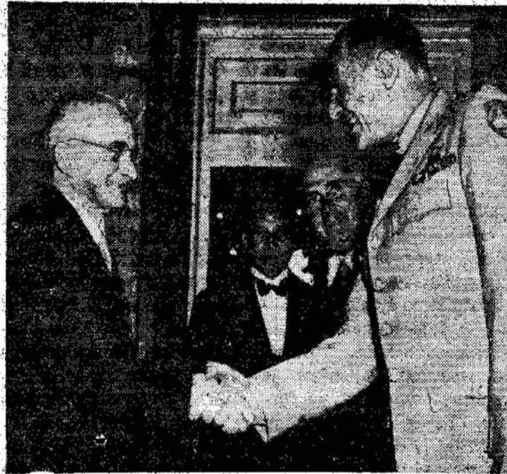
Generolas Ridgway sveikina si su Italijos prezidentu L. Einaudi, bet šį pasisveikina ma. saugojo 50,000 policijos. Italijos darbo žmonės nesveikina generolo Ridgway.

Matant ir suprانتant tą visą karo kurstytojų vedamą moralį terorą prieš taikos trokštančius žmones, tiesiog darosi sunku suprasti, kaip tai civilizuoti ir kultūringi žmonės, ir dar krikščionybės gynėjai, gali sau dasileisti prie tokio žemo ir šlykštaus