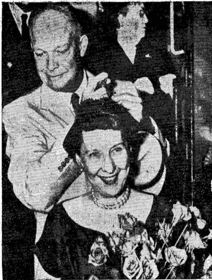
Generolas Eisenhoweras, kurį respublikonai nominavo kandidatu į Jungtinių Valstijų prezidentus.

Kokie tai dipukų neaiškūs Fondai mojami dideliems namų pirkiniams ir tam tikslui pardavinėjami šėrai, ar kas tokio.