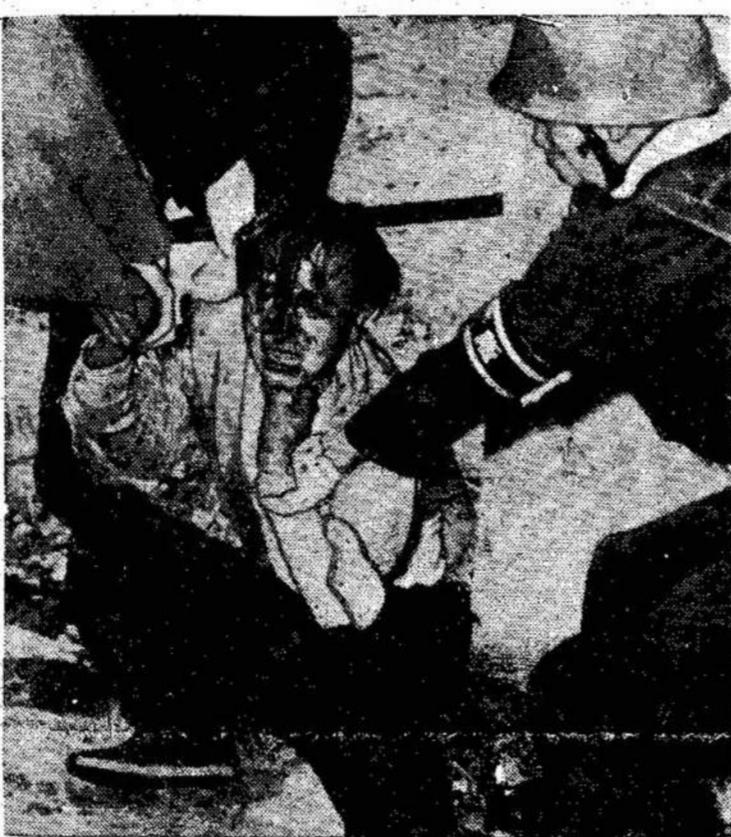
Japonijos policija muša demonstrantą Tokijo mieste. Demonstrantai protestavo prieš pasimojimą suvaržyti unijas.

Buvo priimtas sumanymas rašyti laiškus milijonams amerikiečių, kad arčiau parodyti, jog niekas nenori jų užpulti; kad pasaulio žmonės nori taikos.