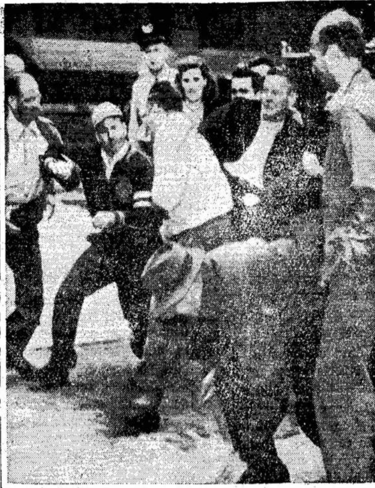
Formanai paprastai yra samdytojų reikalų gynėjai, bet šis formanas pasirodė at-

Kiniečiai atsimokėję britams, kurie atidavė amerikiečių kompanijai virš 40 orlaivių, kurie čia buvo laikę nacionalistų susmukimo Kinijoje.