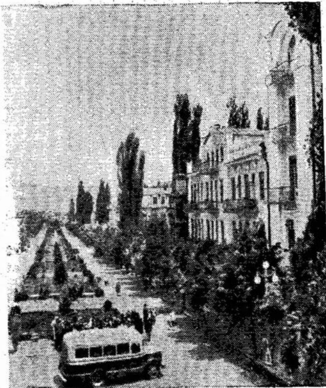
Scena kurorte Kaukaze. Kur pirmiau turčiai vasarodavo, tai dabar darbininkai. Čia matote Stalino alėją Kislovodske

Jeigu karas nebus likviduotas, jis galės kainuoti mažai naujų gyvybių, kurių tarpe bus ir amerikiečių ir kanadiečių.