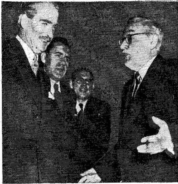
A. Višinskis, Tarybų Sąjungos užsienio reikalų ministras, kalbasi su A. Edenu, Britanijos užsienio reikalų sekretorium. Višinskis matomai kritikuoja Edeną už karą Korėjoje, kuris jau treti metai tęsiasi.

Maskvos spauda vadina Trygve Lie agentu agresyvių Amerikos politikierių. Agresiją jis bando pridengti Jungtinių Tautų vėliava.