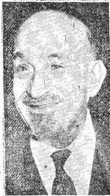
Dr. Chaim Weizman, pirmas Izraelijos prezidentas, kuris perėmė savaitę mirė po ilgo sirginėjimo, sulaukęs 78 metų amžiaus. Jis buvo vadinas Izraelijos tėvu, kadangi jis daug energijos paaukojo siekdamas žydų tautai nepriklausomos valstybės.

Pasiruošimas prasidėjo nuo to, jog generolas Krukas suskaitė savo jėgas. Bendrai paėmus, jo valdžioje buvo beveik dvylika tūkstančių kariuomenės, esančios to milžiniško apskritimo viduryje arba prie pat jo krašto. Generolas Krukas akuratiškai nubrėžė strėles, nukreiptas į centrą. Po to, savo ryškiu braižu prirašęs kelis lapus popieriaus, jis strėlių kalbą išvertė į prastą žodžių