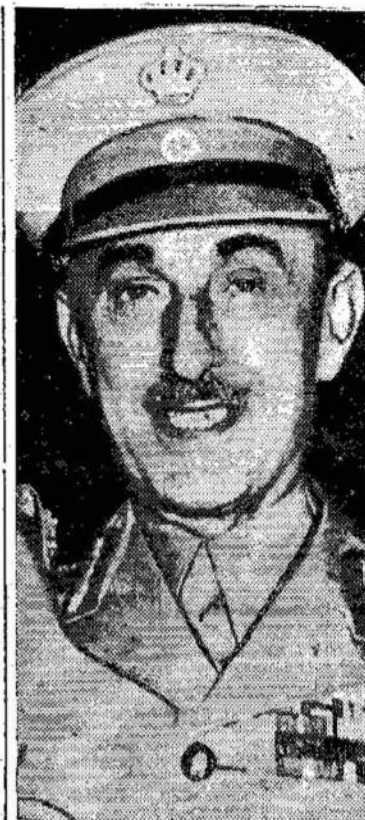
Feldmaršalas Aleksandras Papagos, kurio partija laimėjo rinkimus Graikijoje. Prieš jo partiją ėjo koalicija, palaikoma amerikiečių. Atrodo, kad ir graikai neapkenčia partijų, kurias palaiko amerikiečiai.

Šiais metais respublikos aukštosiose mokyklose mokėsi daugiau kaip 14,000 studentų. Tai beveik keturis kartus viršija 1939 metais besimokančių studentų skai-