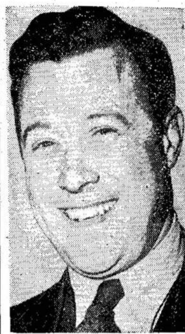
Walter P. Reuther, naujas CIO prezidentas. Dabar jis svajojas jau apie Jungtinių Valstijų prezidentystę.

dama už taiką sykių su pažangiuoju pasauliu, gali ne tik pastoti kelią pasauliniam karui, bet ir palengvinti pavergtiems žmonėms atsiekti savo tautinės laisvės.