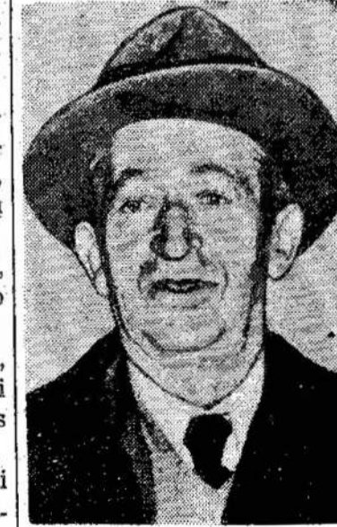
Yitzhak Ben-Zvi, naujas Izraelijos prezidentas. Jis yra socialistinis zionistas.

Kas gali pasakyti, kurioj pusėj būtų arabiški kraštai,