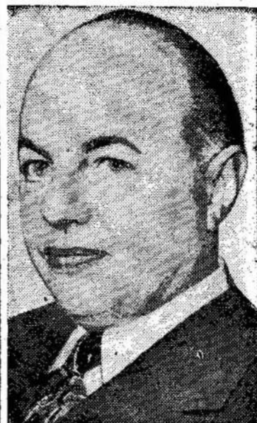
Mitchell F. Hepburn, buvęs Ontarijos premjeras, kurio aną dieną mirė, sulaukęs 56 metų amžiaus. Jis premjeravo 8 metus iki 1942 metų. Jis nelabai sutiko su nacionaliais liberalų lyderiais, nors skaitėsi liberalu ir buvo Ontarijos liberalų lyderiu iki pasitraukė iš politinio veikimo.