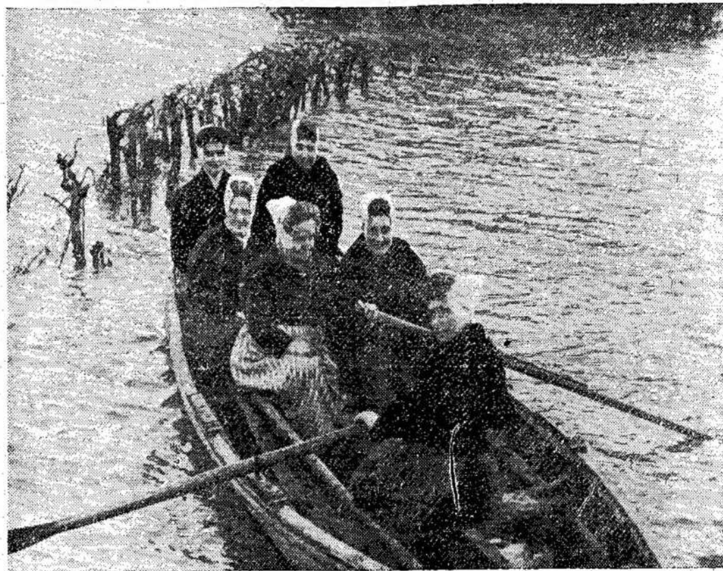
Šis vaizdas parodo kas atsitiko su Olandijos ir Anglijos pajūriais. Vietomis vanduo pasiekė 40 mylių nuo pajūrio. Čia matote olandes gelbėjimosi valtyje.

Galima gauti ir Kanadoje rašytojo I. F. Stone knyga