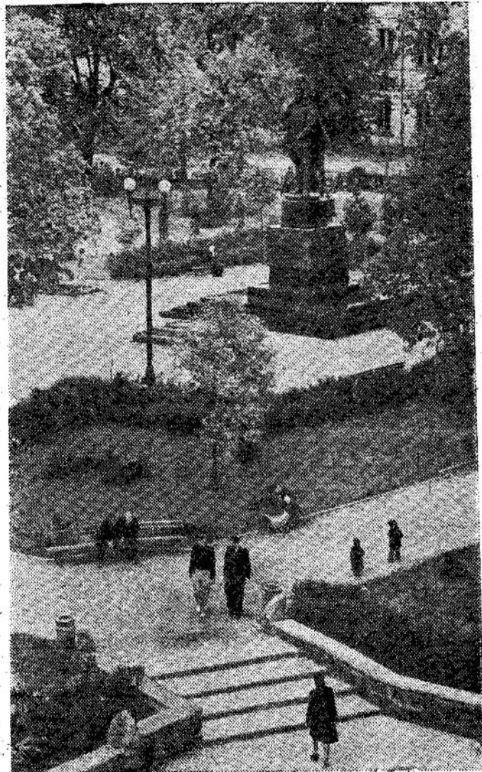
Generolo Černiakovskio paminklas Vilniuje, Tarybų Lietuvos sostinėje. Jis žuvo bevaudojant Lietuvą iš hitlerininkų, tad Lietuva, pagerbimui jo, pastatė paminklą.