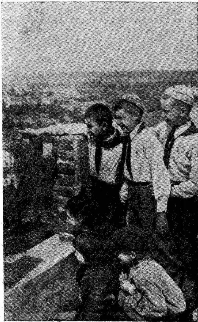
Grupė Vilniaus vaikučių stovyklos vaikų, kurie šiemet išvyko į Gedimino pilį. Per daugelį metų Gedimino pilis buvo svetimųjų rankose, bet dabar ji randasi Gedimino ainių rankose. Ji gražinta lietuviams visiems laikams.

Čiami techniniai žurnalai fizikos klausimais, iš Kanados — tekstilės klausimais, iš Pietų Afrikos Sąjungos — elektrotechnikos klausimais. Biblioteka gauna taip pat žurnalų iš Australijos, Švedijos, Anglijos, Prancūzijos, JAV ir daugelio kitų šalių.