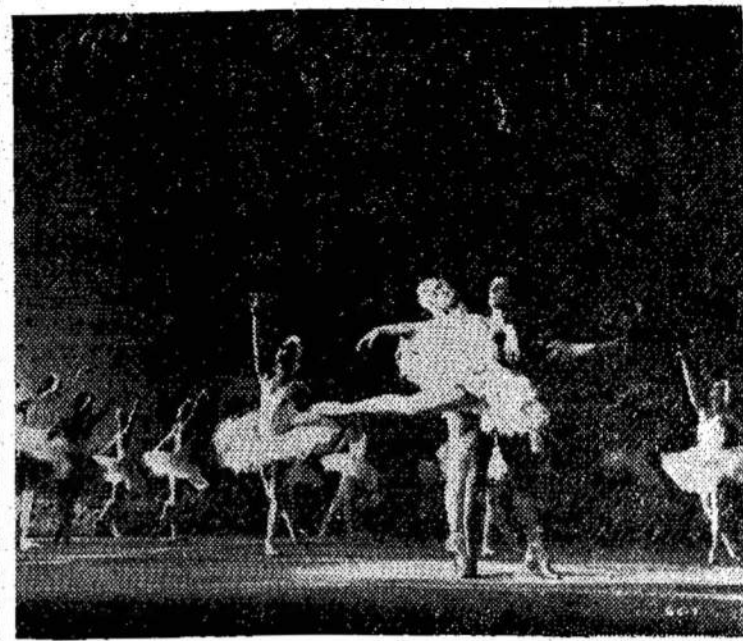
Scena iš tarybinės filmo "The Grand Concert", kuri baletu, muzikos ir dainų lododoma Studio teatre, Colbynas.