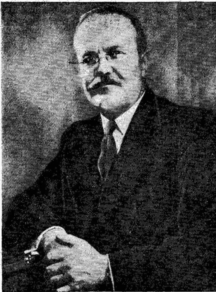
V. M. Molotovas, kurs paskirtas užsienio reikalų ministrui. Jis perima pareigas iš Višinskio, kurs paskirtas nuolatinis Tarybų Sąjungos delegatu Jungtinėm Tautom.

Kiti, įsivaizduodami, kad Stalinui mirus, mirė ir tas tarybinių žmonių nepalaužiamas ir nepalenkiamas ryžtingumas žengti į komunizmą, — ėmė šaukti, kad dabar atsiradus geriausia proga užpulti Tarybų Sąjungą ir su-