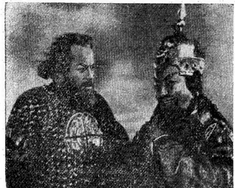
Scena iš tarybinės filmo "The Grand Concert", kuri rodoma Studio teatre, Col-

jos Amerikos valdžiai, "Amerikos Balsas" pabrėžia kaip tik atbulus dalykus: — jis teigia, kad pas mus yra plati socialio saugumo sistema, jis teigia, kad unijos pas mus turi daug balso krašto valdyje, jis pabrėžia, kad pas mus medicina eina link socializavimo, ir taip toliau. Arba, paimkime moderniško meno klausimą. "Know nothing" reakcininkai yra įsikalbėję, kad moderniškas menas rišasi su komunizmu. Bet "Amerikos Balso" vedėjai, geriau suprasdami padėję, žino, kad girdami abstraktinį meną jie skleidžia formalizmą ir tokiu būdu bent kiek padeda formalistiniams menininkams Liaudies Demokratijoje, ant kiek jų (Pabaiga ant 12 pusl.)