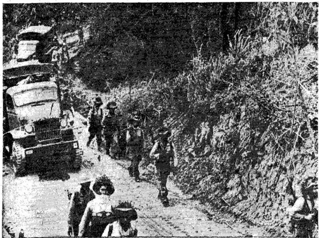
Scena Indo-Kinijoje, kur francūzai kariauja prieš vietnamiečius, ginančius savo šalis nepriklausomybę. Amerikiečiai esą pasirengę susijungti tą karą su Korėjos karu ir mesti didesnę pagalbą francūzams, nenorintiems išeiti iš ten.