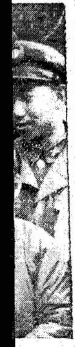
uo metų, buvo "ne- a.