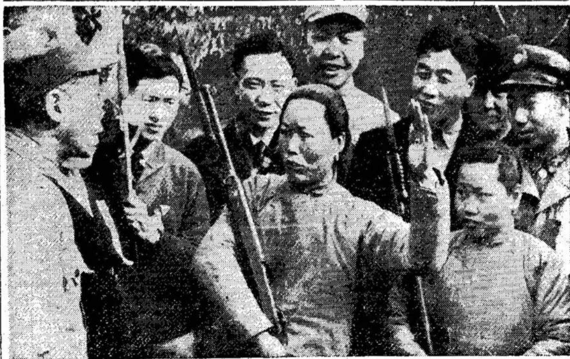
Dvi kaisekininkų moterys puolimo ant Kinijos pakraščio. Sakoma, kad kaisekininkai tokius užpuolimus darė labai dažnai net tuo metu, kada amerikiečiai buvo "neutralizavę" Formosą.