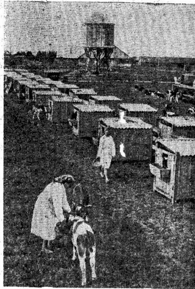
Aušros kolektyvo Šiaulių apylinkėj veršiukų kempė. Kolektyvinis ūkininkavimas yra moderniškas ūkininkavi- mas, nešas daug didesnę nau- dą ūkininkams.

Naujų medicinos įstaigų tarpe - ligoninė, du medic- nos punktai, ambulatorija ir