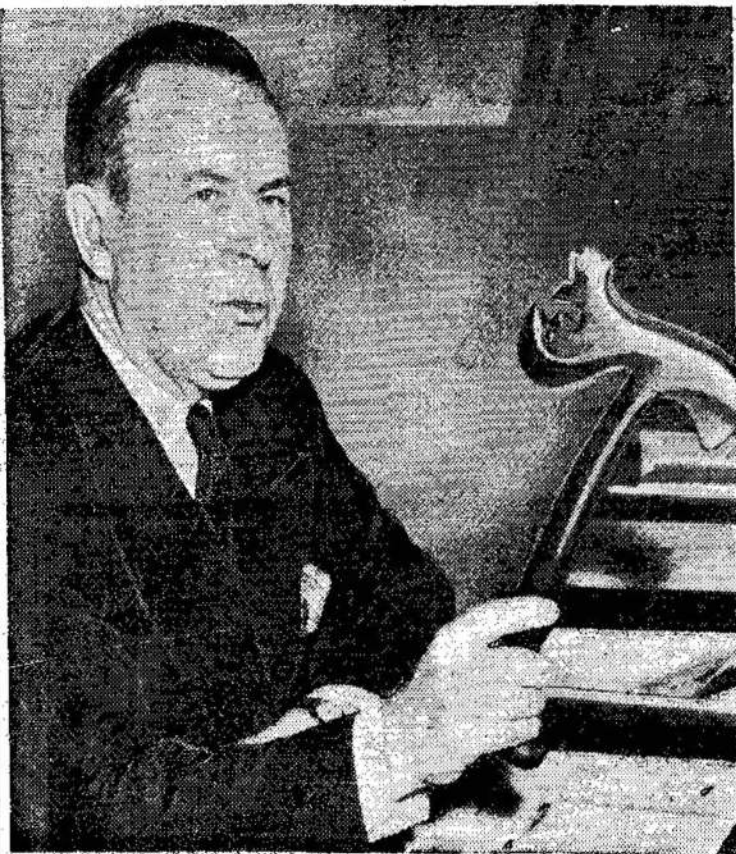
Lester B. Pearson, Kanados užsienio reikalų ministeris, JT generalės asamblėjos pirmininkaujant asamblėjai.

Tuo tikslu buvo sudaryta neutrali komisija, kuri išty-