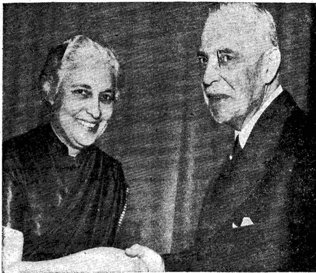
Indijos premjero Nehru se- suo Pandit, Jungtinių Tautų Indijos delegacijos galva, sveikinasi su Kanados prem-

Kiek per praėjusį karą išėikvota pinigų, už juos bū- tų galima pastatyti namus