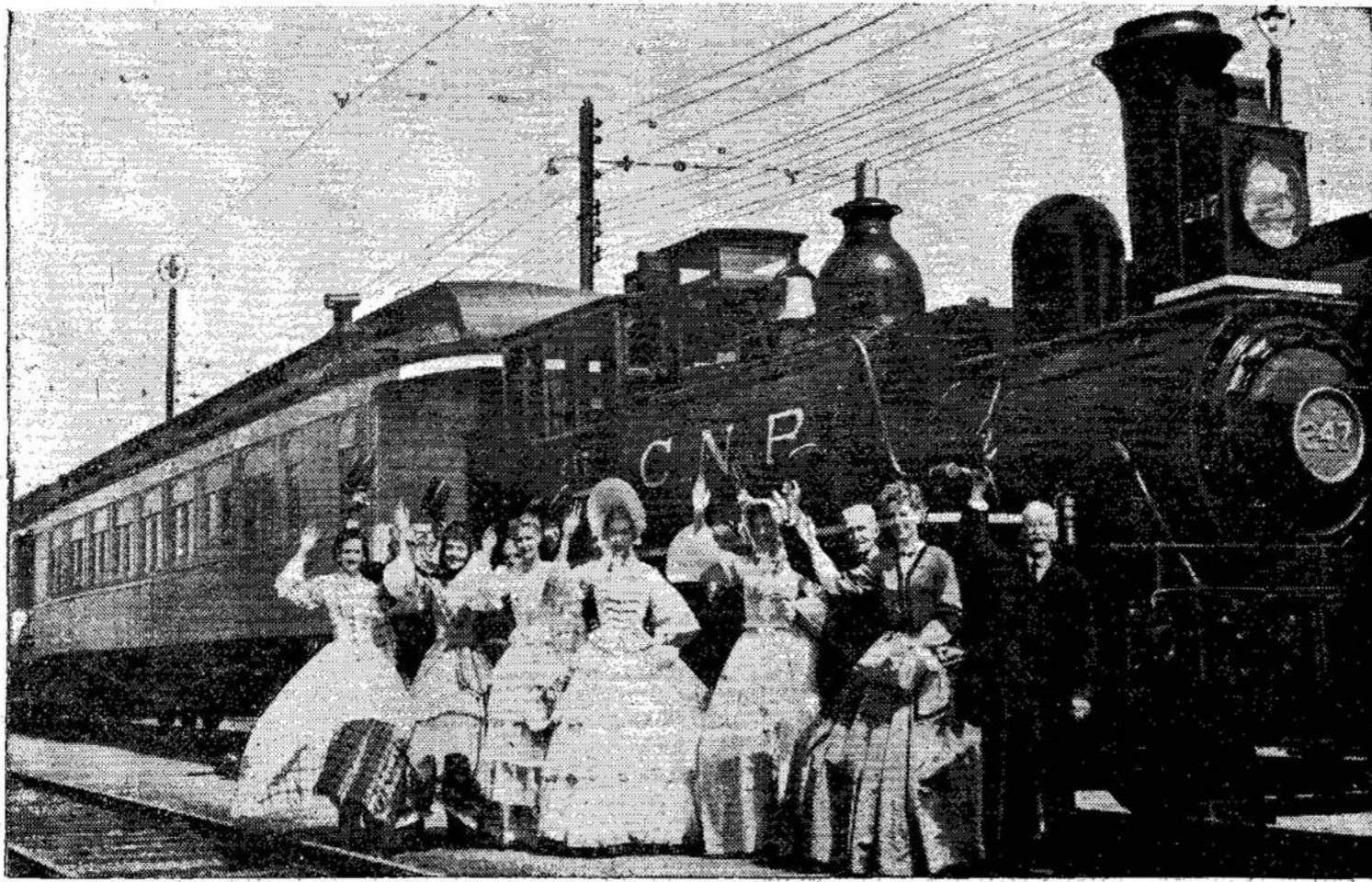
Senoviškas CNR garvežys Montrealo centralinėj stotyj. Vagone, kurs stovi užpakalyje, sudėti visi "likučiai" iš tų laikų, kada šis garvežys buvo moderniškias. Traukiniai Kanadoje pasirodė 1836 metais. Šis "muziejus" ant ratų gegužio 16 pribus į Aurora ryšyje su paminėjimu 100 metų kaip pasirodė traukinys Ontarijoj.