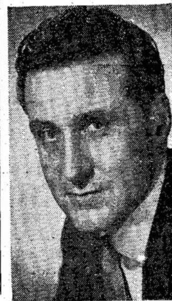
Patrick MacNee, naujas Kanados radio artistas, kurs yra atvykęs iš Anglijos.

Jūsų Dėdė Vincas mislina, kad mes, šteitiečiai, įsinarpliojė kaip anas gaidelis į siūlų tolka, vargu iki sūdno dienos be išsinarpliosime.