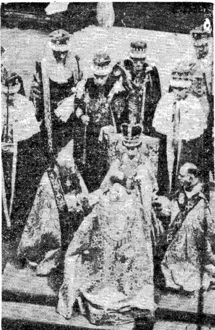
Arkivyskupai atiduoda parvo apkarūnavota. Čia ji ma- garbą Anglijos karalienei toma sėdint ant sosto su ka- Elizabetai II po to, kai ji bu- rūna ant galvos.