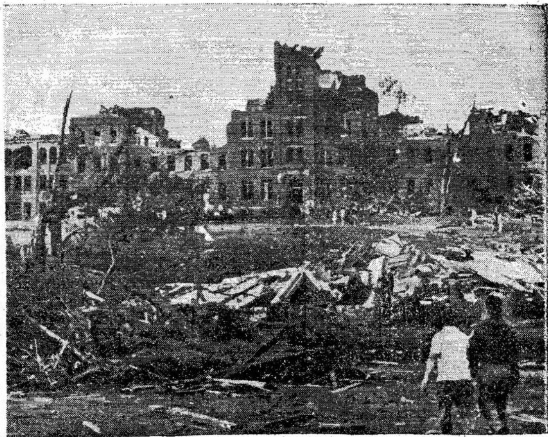
Assumption kolegija Worcesteryje, Jungtinėse Valstijose, po tornado. Laike torna-

Jis sako, kad nebus galima išspręsti Indo-Kinijos problemos pasitraukiant iš ten ar tęsiant karą. Nebūsią galima tos problemos išspręsti ir pavertus tarptautiniu reikalu.