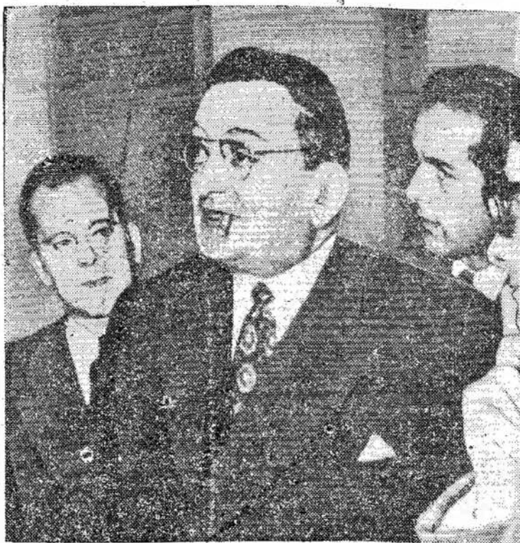
Naujas Francijos premjeras Joseph Laniel, 64 metų amžiaus, milijonierius. Tai jau 19-tas po karo. Ameriečiai

teigia, kad jis turi mažą pa-tyrimą ir vargiai išsilaikys ilgai. Į jo kabinetą įeina net šeši buvę premjerai.