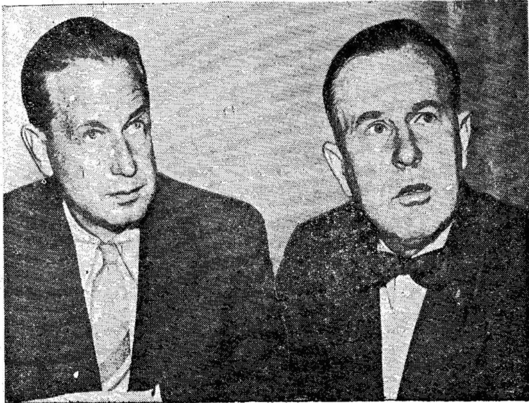
Jungtinių Tautų lyderiai: Dag Hammarskjöld, kuris prezidentas Lester B. Pearson (dešinėje) ir sekretorius, dël Syngman Rhee užsispyritarësi Ottawoj, kaip pašalinti susidariusiã krizã Korëjoje mo nesirašyti paliaubų, dël kurių jau susitarta.