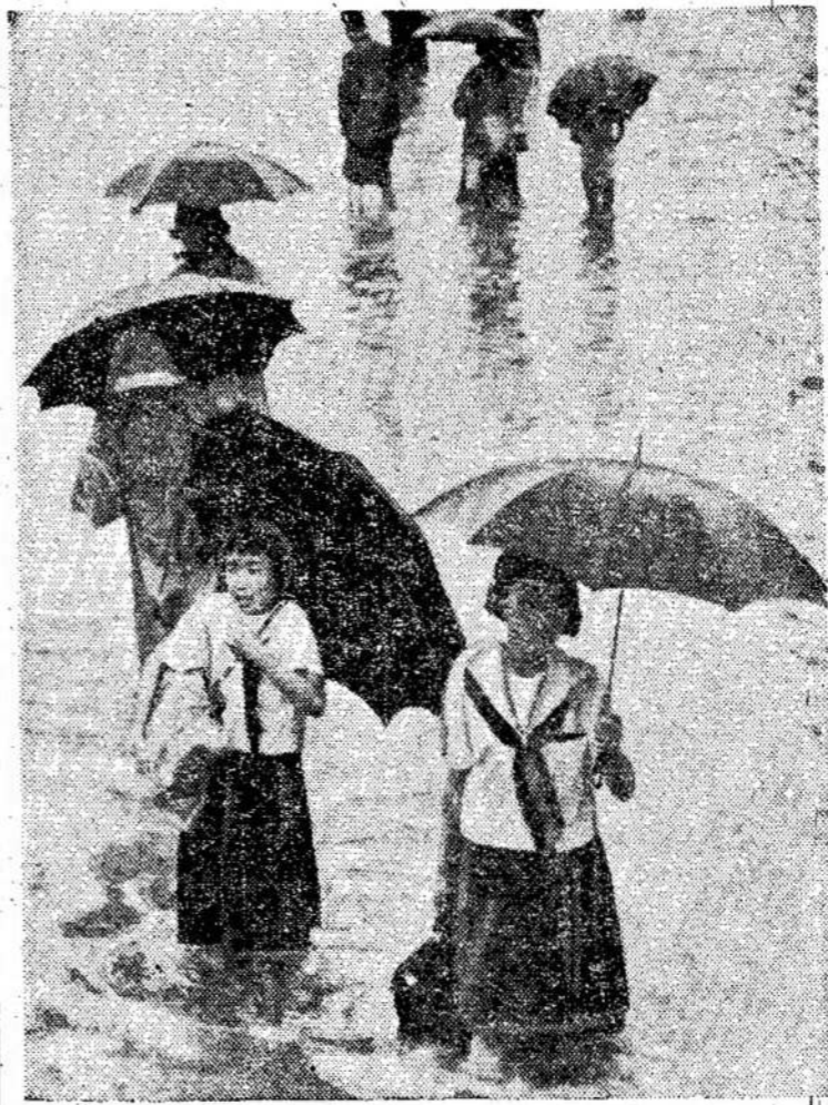
Čia matote sceną ant gatvės žmonių. Apskaičiuota, kad Fukuoka mieste, Japonijoje, potvinis pridarė žalos už kur potvinis pražudė 400 $500,000,000.