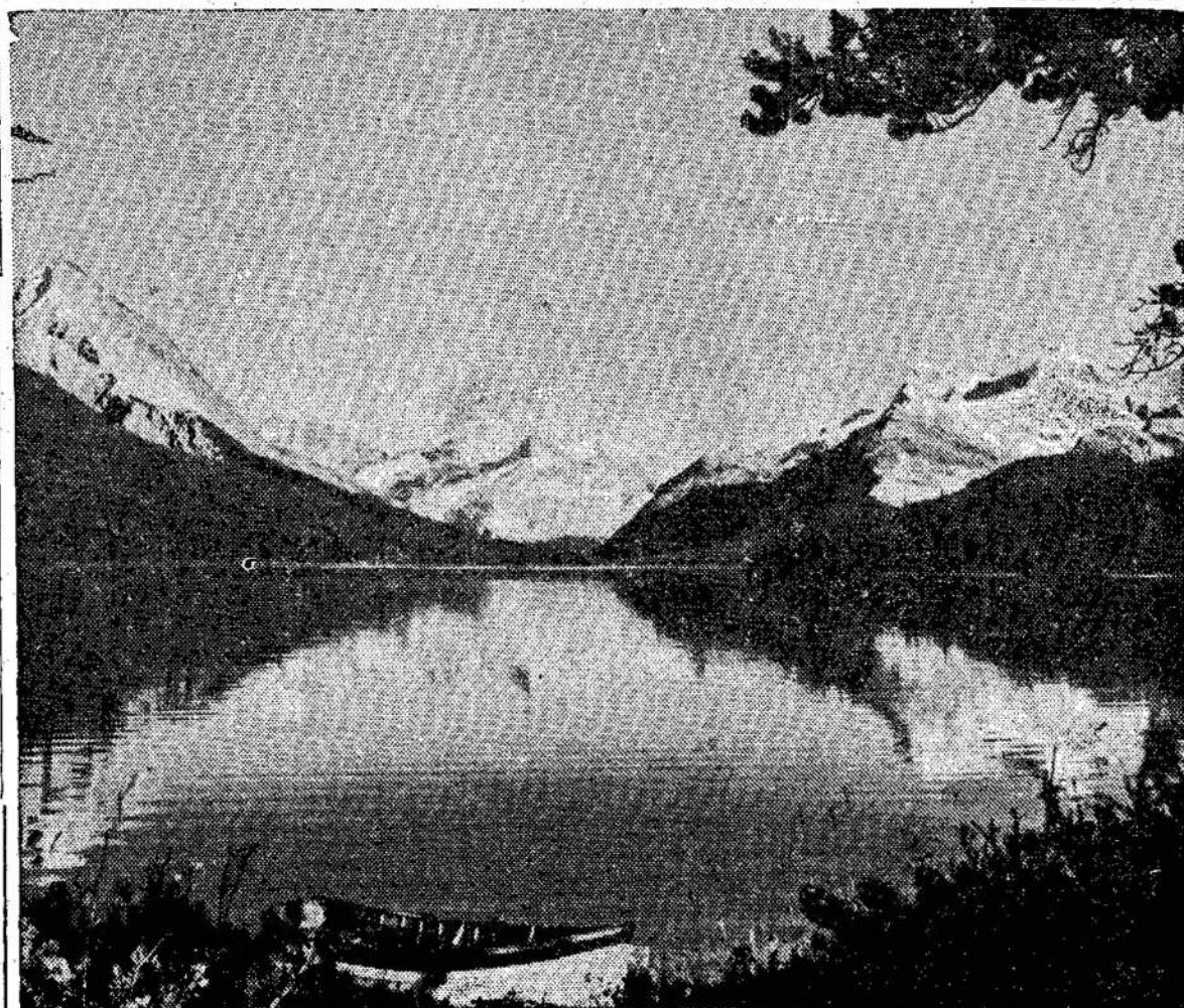
Kanados valdžia, kad jam žinoma "Queen Elizabeth Ranges" nus karalienės Elizabethos II ligne ežerą Alberto pavadinimu.

Jeį Norite Žinoti, Kas Tikrai Dedasi Pasauly, Skaitykit Liaudies Balsą