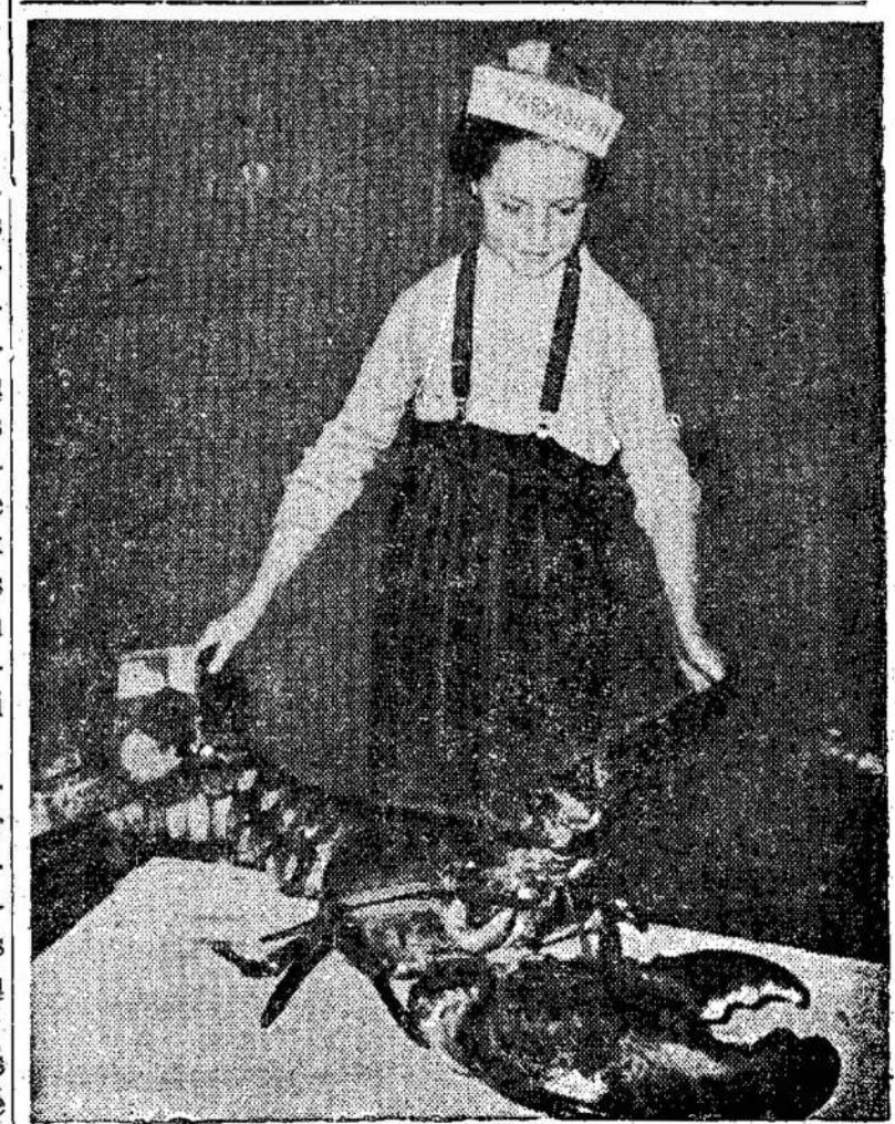
Ką jūs darytumėt pamatę mergaitę prie 24 svarų vėžio vandenyje 25 svarų vėžį? O Nova Scotia vandenyse yra dar didesnių. Čia matote