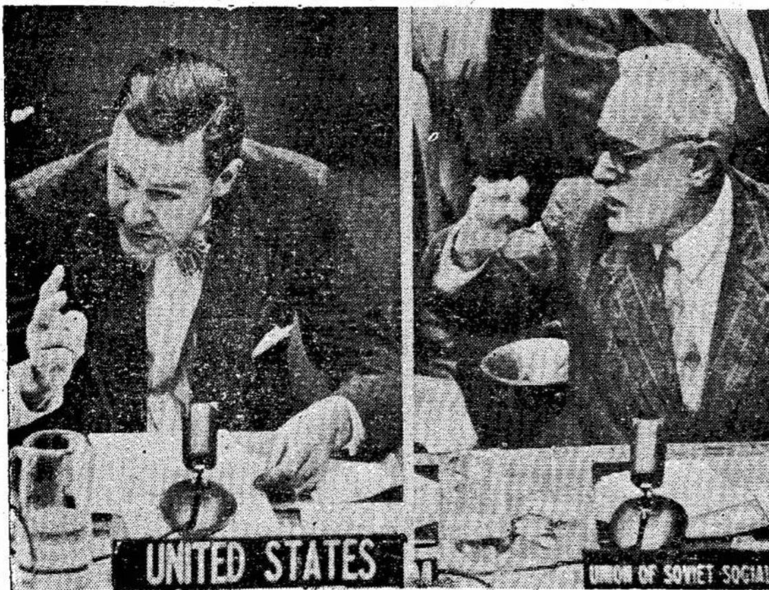
Henry Cabot Lodge, Jr., Jungtinių Valstijų atstovas, ir Andrei Višinski, Tarybų Sąjungos atstovas, veda žo-

Laikinosios Bendravokiškos vyriausybės uždaviniai: a) Laikina Bendravokiška vyriausybė galėtų spręsti tokius neatidėliotinus bendravokiškos reikšmės klausimus kaip: atstovavimas Vokietijai parengiant taikos sutartį, o taip pat atstovavimas tarptautinėse organizacijose; neleidimas įtraukti Vokietiją į koalicijas arba karines sąjungas, nukreiptas prieš bet kurią valstybę, dalyvavimą savo ginkluotosiomis pajėgomis kare prieš hitlerinę Vokietiją; Vokietijos pilietybės klausimai; užtikrinimas laisvos demokratinėms partijoms bei organizacijoms veiklos ir neleidimas egzistuoti fašistinėms, militaristinėms bei kitoms organizacijoms, priešiškomis demokratijai ir taikos išsaugojimo reikalui; plėtimas prekybinių santykių tarp Rytų ir Vakarų Vokietijos; transporto, pašto ir telegrafo ryšių klausimai; klausimai dėl laisvo žmonių ir prekių judėjimo, nepriklausomai nuo nustatytųjų zoninių sienų; ekonominių ir kultūrinių ryšių tarp Rytų ir Vakarų Vokietijos vystymo ir kitų klausimai, liečiantieji