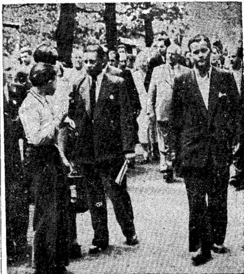
Wilhelm Pieck, Rytinės Vokietijos prezidentas (šviesiu šai tą gerai žino, tad stenkempėj prie Berlyno. Jaunoji karta, nesuteršta nacizmu, yra Vokietijos ateitis. Priešai tą gerai žino, tad stengiasi sukelti maištus dabar.

"... ir tokiu būdu geležinė užuolaida palengva bus pakelta. Ši šalis, tarp Elbės ir Oderio, yra pašaukta atlikti didelius dalykus. Priklausydama Vakarams, ji susitiko su Rytiais. Tai čia gali būti pastatytas tiltas tarp dviejų pasaulių, kuris gali sulaukyti mus nuo naujo pasaulinio karo, ir vakarinis individualus (Pabaiga ant 12 pusl.)