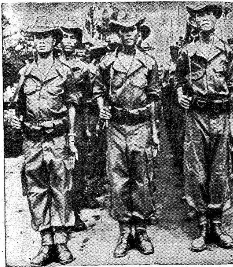
Amerikiečių apginkluoti, o vo šalies laisvę. Kolonijų francūzų išlavinti Vietnamo vyrai, kuriuos francūzai naudoja prieš Vietnamo liaudies jėgas, kovojančias už sa-

Tai džiuginanti reiškiniai. Šia proga pakartotinai kreipiamės į tuos draugus ir drauges, kurie dar nepradėjote vajas veiklos, kad vis-