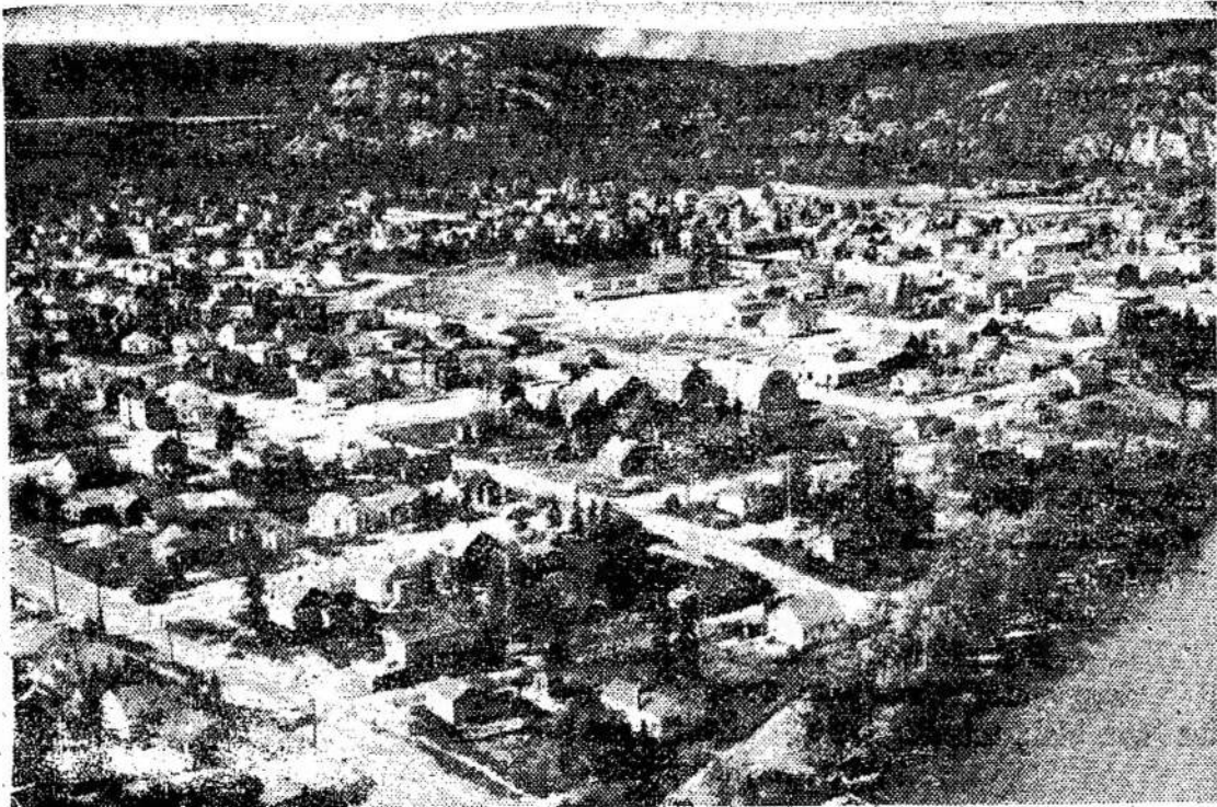
Wawa, 2,500 gyventojų miestas. Ontarijos provincijoje, šiaurėje Sault Ste. Marie.

LLD Kanados Veikiantis Komitetas P. O. Sta. C., Box 1007 Toronto 3, Ont.