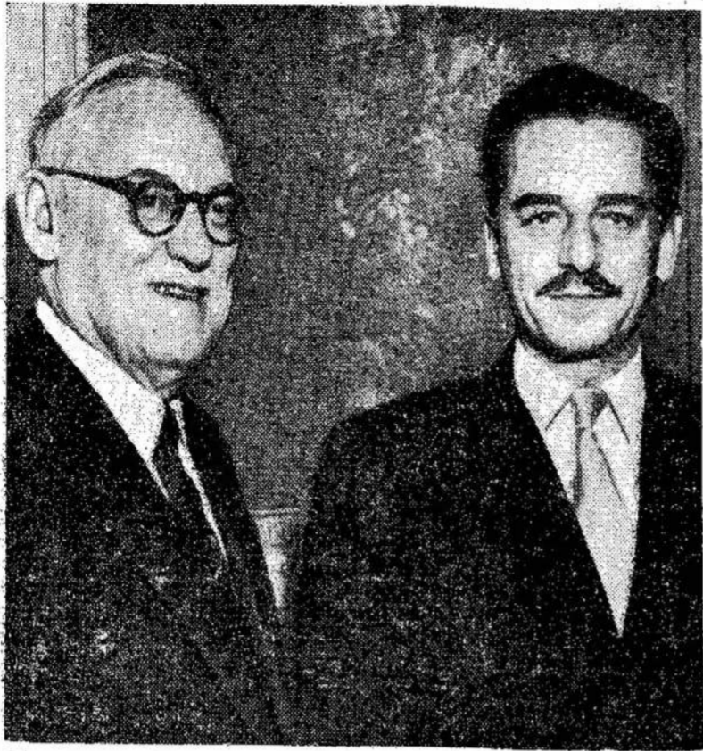
A. Višinskis ir K. Popovic, tojas, jugoslavų ambasados Tarybų Sąjungos užsienio srengtame baliuje, New Yorke. Abiejų šalių santykiai tojas ir Jugoslavijos užsienio pastaruju laiku žymiai pareikalų ministerio pavaduo- gerėjo.

Pavyzdžiui, iš Kardelio jau parodytų gabumų praeityje, atrodo, kad jis geriau tinka programų organizavimui, o ne taikytojo misijai.