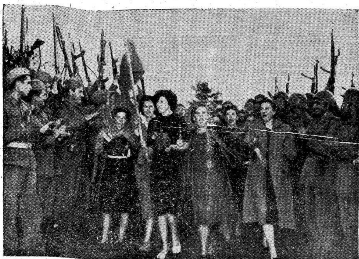
Jugoslavės sveikina Tito kariuomenės su tankais ir reikius, kurie pribuvo į zoną A italams. Italai sutraukė prie jugoslavų sienos daugybę kariuomenės su tankais ir kanuolėmis. A zonoje policija nušovė 6 italus.