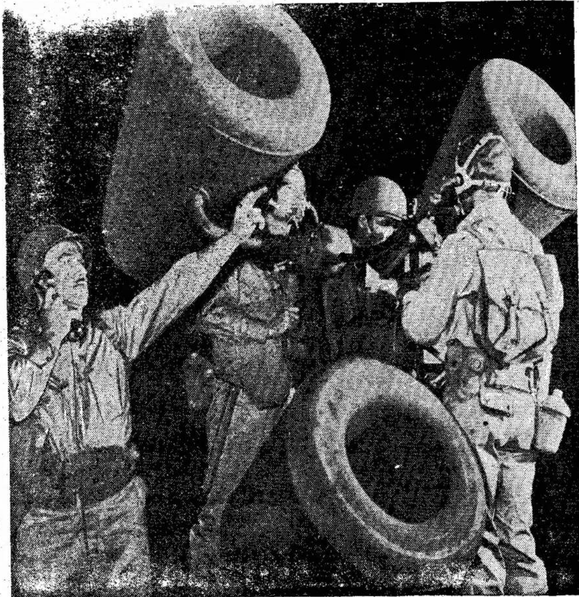
Netoli Ottawos pastatyta stotis su čia matomu prie- taisu sekti skraidančias lėkš-

Aplamai, užimant žemę, val- džia skyrė rezervus dėl indi- jonų ir pasižadėjo remti fi- nansiniai, parūpinti apšvie- tos priemones ir t. t. Beveik pusė Kanados indijonų ran- dasi po tokiomis sutartimis. Bet vyriausybė taiko tas pa- čias sąlygas ir tiems, kurie neturi sutarčių.