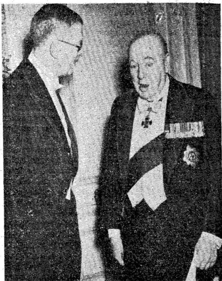
Svedijos karalius Gustaf Adolf kalbasi su Britanijos premjeru Churchill. Churchill buvo apdovanotas Nobelio dovana už literatūrą. Gruodžio pradžioje Churchill vyks į Bermudų pasimatytį su Eisenhoweru.