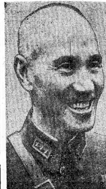
Jie net panašūs vienas į kitą. Tai Čiang Kai-šekas ir Syngman Rhee, kurie pastaruoju metu laikui tarėsi, kaip suardyti

Stiprėjanti darbo žmonių vienybė — sėkmingos kovos už geresnį gyvenimą, už taiką tautų tarpe laidas.