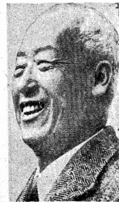
derybas dėl taikos ir atnauinti karą prieš Kiniją ir Šiaurės Korėją. Dar neužteko jiems žmonių kraujo.

Jis taipgi yra pasakęs: „Nei vienas negali būti tikru Kristaus pasekėju, jei jo patriotizmas veda jį prie agitacijos už karą.“