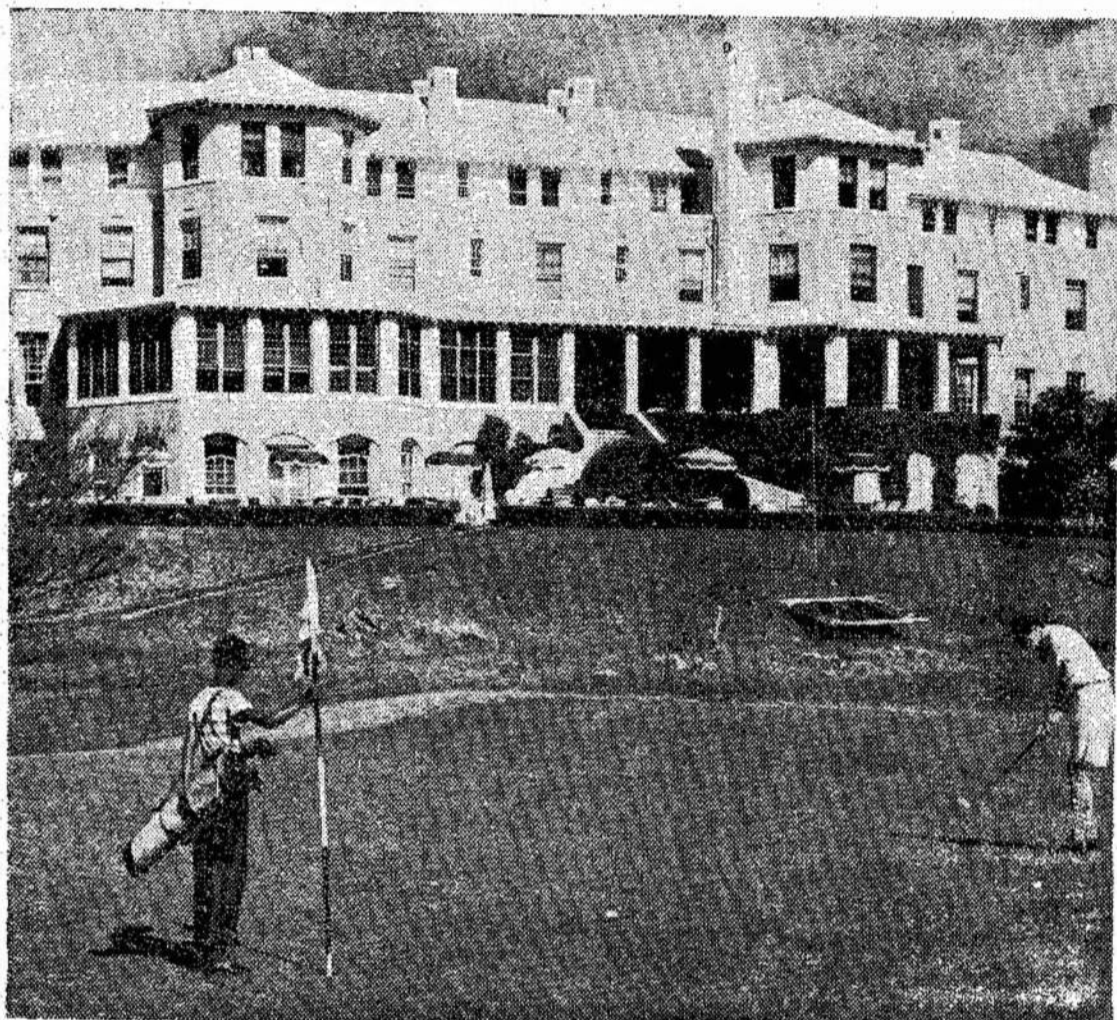
Ocean Klubas Tuckers miesto, Bermudoj, kur įvyko Churchillio, Eisenhowero ir Lanielo konferencija. Sako, pasitarimuose. Ji pavažiavo ma, kad Laniel buvo susirgęs ir mažai dalyvavo tuose ve didelio sklandumo.