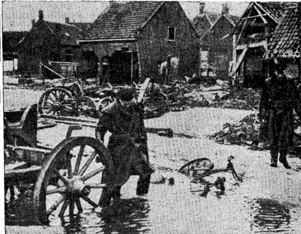
Jau devyni mėnesiai praėjo nuo potviniio Olandijoje, bet jo pasekmės dar vis matomos. Štai scena Ouđe Tonge mieste. Užtvankos jau sutaisytos, bet ims nemažai laiko, kol bus išpumpuotas vanduo iš žemų vietų, kurių Olandijoje yra labai daug.