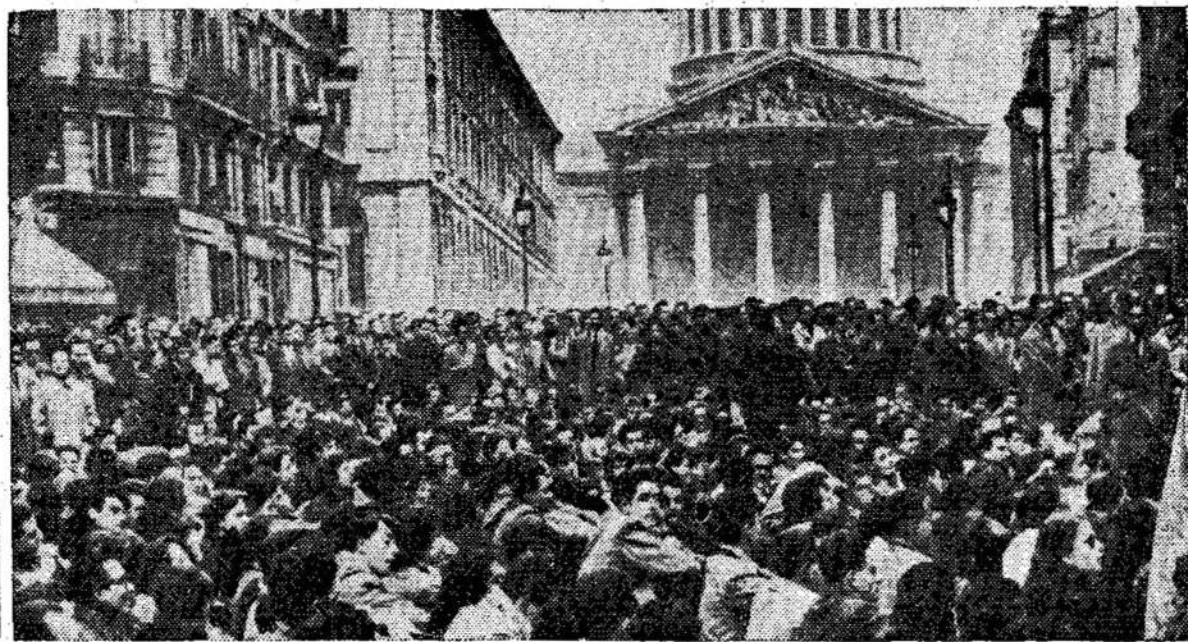
Francijos studentai demon- struoja protestuodami prieš pasimojimą sumažinti išlai-