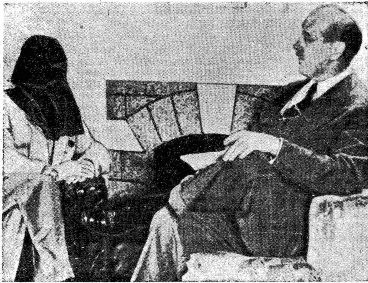
Igor Guzenko (su maišu ant galvos) kalbasi su amerikiečių televizijos. Panašius maišus dėvėjo lietuviški "liudi-

gimas buvo nufilmuotas ir ninkai", kurio liudi- vėliau rodomas ant amerikiečių televizijos. Panašius maišus dėvėjo lietuviški "liudi-