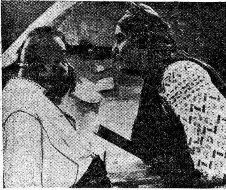
Scena iš naujos tarybinės teatro, College ir Manning, Toronto, pradedant vasario 15 dieną.

"Darbadienių turiu 67. Už darbadienių dar tebesam atlyginimo negavę. Avanso gavau 1 centnerį rugių. Gyvulių turiu: vieną ožką, nusipirkau avį, kuri jau turi