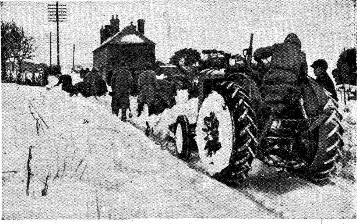
Angliją, kaip ir visą Euro-das viename angly kaime | krytyje. Šalčiai ir sniegas nu- pa, užklupo žiema. Štai vaiz- prie Otterdeno, Kento aps- sinešė 500 žmonių Europoj.