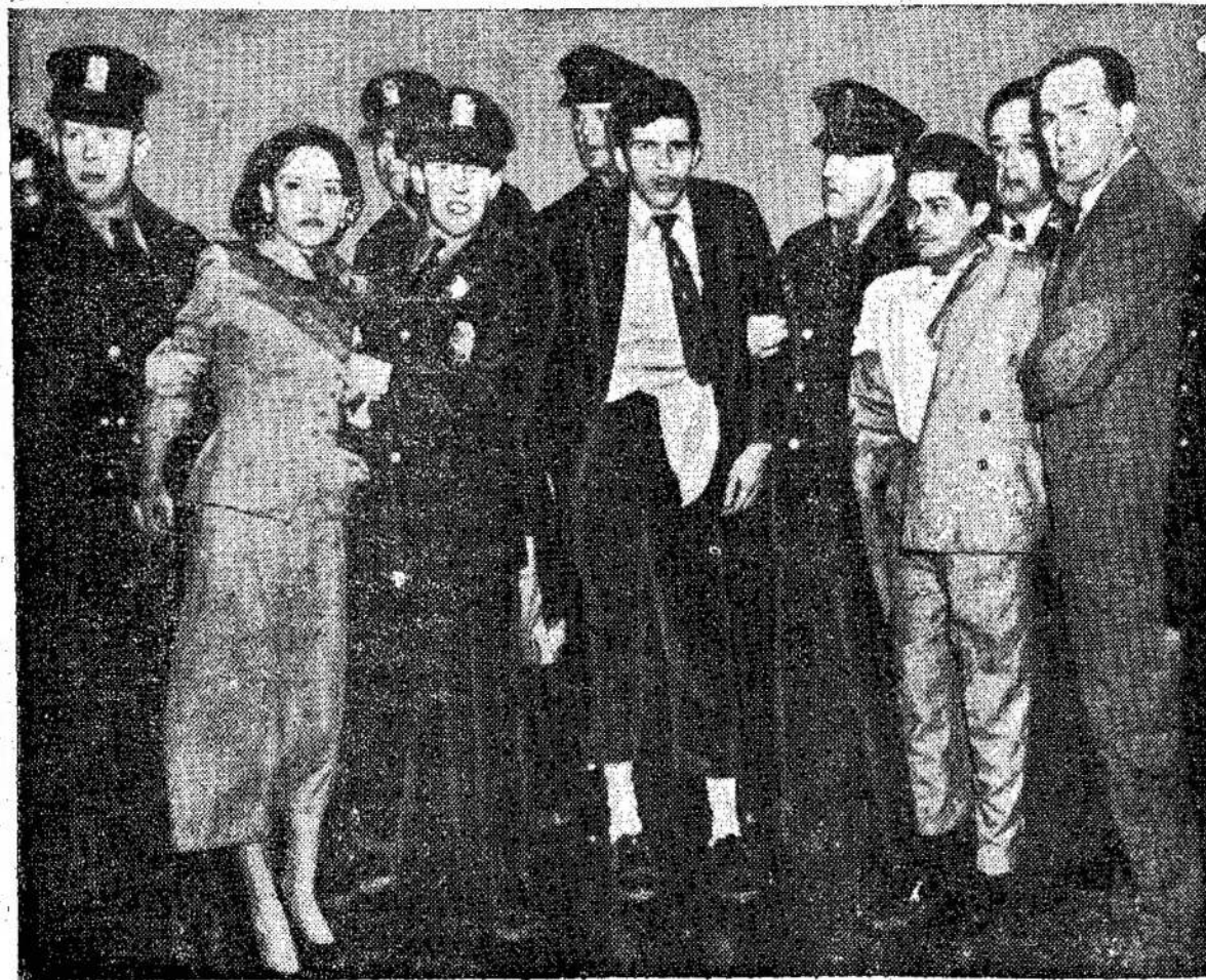
Washingtono policija laiko kongresmanus. Ketvirtas buvo pabėgęs, bet vėliau sugautas lipant į busą. Jie priklausė so prie nacionalistų partijos, kuri reikalauja Puerto Rico nepriklausomybės.

Jie nuo 6 iki 18 mėnesių maitino tūlas beždžiones tokiu maistu, kuriame stokavo minimo vitamino, ir jie pastebėjo pas tas beždžiones