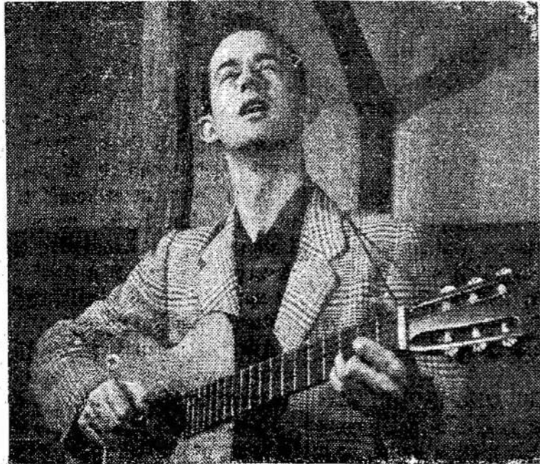
Ed McCurdy, liaudies dainų mylėtojas. Jis dainuoja ant radio iš CBC stočių. Sakoma, kad jis yra surinkęs keletą tūkstančių baladų.

LLD Kanados Veikiamis Komitetas P. O. Sta. C., Box 1007 Toronto 3, Ont