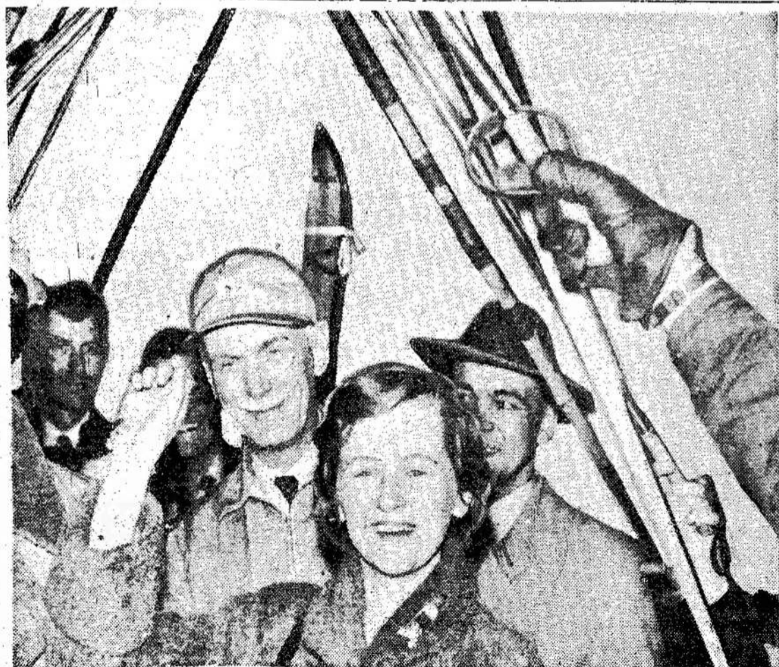
Anne Heggtvei, ottafietė, vos netapusi pasauline slidinėjimo čempijone, grįžta namo. Vistiek, jei ji nebūtų parpuolusi, tai būtų buvus pirma. Vistiek, ji labai gerai pasirodė

Bet sekmadienį galima pirkintis kiek kas nori minkštų gėrimų, cigaretų ir daugelį kitų daiktų.