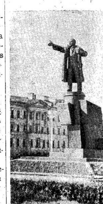
Lenino paminklas Suomijos stotyje Leningrade.

Iš viso rajono kolūkiai, padedant mašinų - traktorių stočiai, įsisavins daugiau kaip 400 ha naujų žemių.