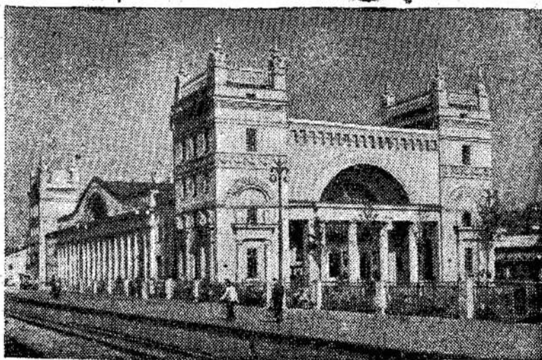
Nauja geležinkelio stotis Smolenske, Tarybų Sąjungoj.