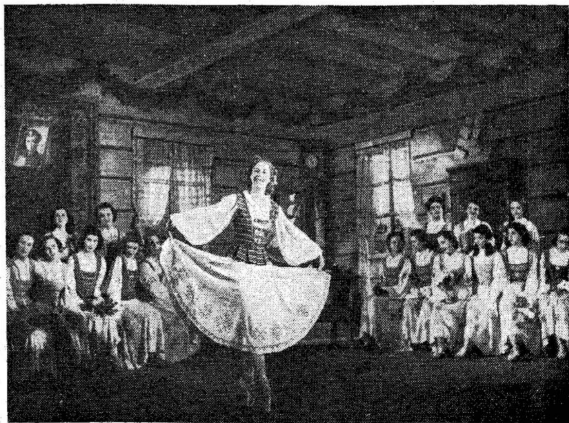
Scena iš lietuviško baletu "Ant Marių Kranto", sukurto kompozitoriaus J. Juzeliūno. Ji buvo pastatyta Maskvoje laike meno ir literatūros dekados. Ona, viena iš links-

Štai, pavyzdžiui, Gustas. Tai gana aktyviai veikiantis asmuo, bet spektaklyje jis neturi choreografinės charakteristikos. O juk baletmeisteriai čia turėjo plačią veikimo dirvą, juo labiau, kad visa baletu muzika tokia gyva ir emocinė, taip persunkta šokių ritmais, jog dar daugiau padeda išspręsti paveikslus.