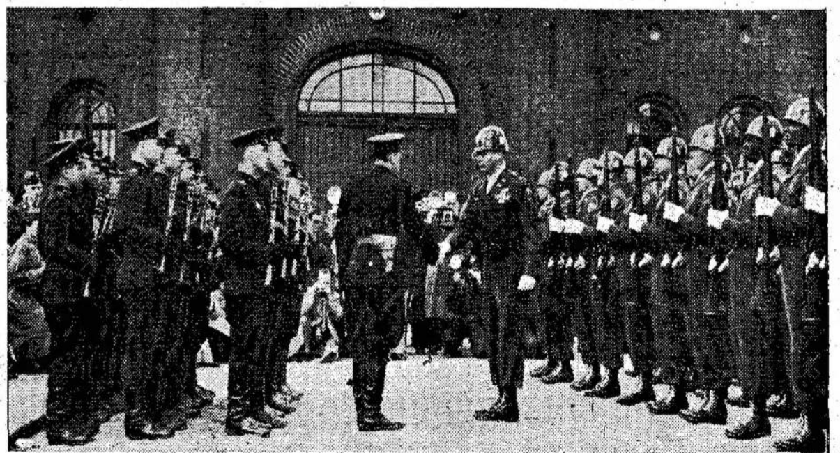
Spandau kalėjimas, kur laikomi didieji vokiečių kariniai kariai, o kitą vakariečiai, ceremonijos. Vieną pamainą Adenauer nori juos visus iš-nusikaltėliai. Prie kalėjimo sargyboje stovi tarybiniai laisvintai.

Jis buvo Mackenzie rėmėjas ilgą laiką ir buvo lyderis Pickering apylinkėj. Po pralaimėjimo ant Yonge gatvės, jis ir grupė draugų norėjo pasislėpti savo draugo