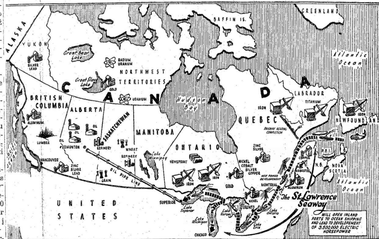
Šiame žemėlapyje parodoma, kaip giliai į Kanados kraštą plauktų jūrų laivai pagilinus St. Lawrence upę. Sakoma, kad tada paupys taptų Amerikos industriniu Reinu. Amerikiečiai, kaip atrodo, moka jasi pasigrobtį kontrole.

Sekantis saulės užtemimas, kurs bus matomas rytinėje Kvebeko dalyje, įvyks tik-tai 1963 metais.