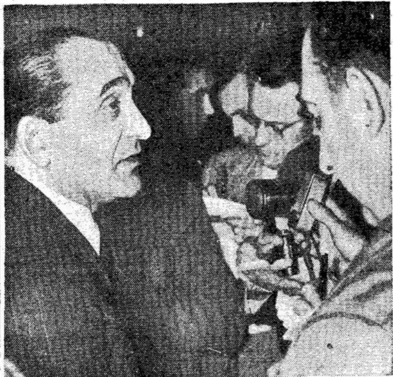
Francijos spaudos reporteriai ir fotografai kalbasi su Mendes-France, kurs pasižadėjo atsteigti taiką Indokinajauje arba rezignuoti.