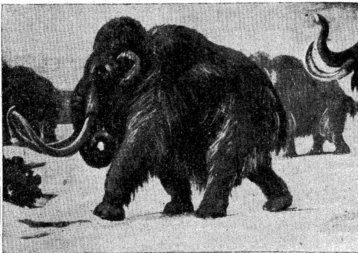
Netoli Chatham, Ontario, atrasta kaulų, kurie rodo, kad gyveno taip vadinami mastodontai, kurių piešinius čia matote. Tikimasi surasti užtektinai kaulų, kad būtų galima sudaryti visą skeletoną.

Linkėjimų jums, miela teta, nuo visų, o ypač daug nuo mano mamytės, jūsų sesutės. Siunčia jums linkėjimus ir linki laimingų dienų visas jūsų gimtasis kraštas. Lukšių kaimo miškai ir kloniai,