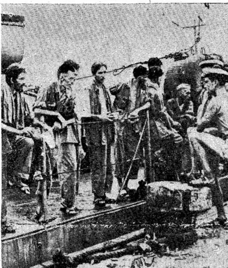
Francūzai belaisviai grįžta iš grįžta namo, kadangi paliaubelaisvės. Jie buvo suimti bos pasirašytos ir apsikietit-Dien Bien Phu, bet dabar jau mas belaisviais jau pradėtas.

TORONTO. — Generolas Crerar, kalbėdamas veteranų konvencijoje, reikalavo, kad Kanada įvestų verstinę karinę tarnybą.