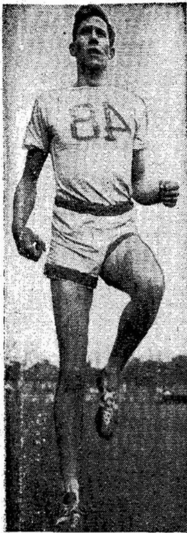
Roger Bannister, bėgikas iš Anglijos, kurs sumušė australą Landy bėgimo lenktynėse Vancouveryje! Savo greitumu sumušė pirmąjį rekordą.