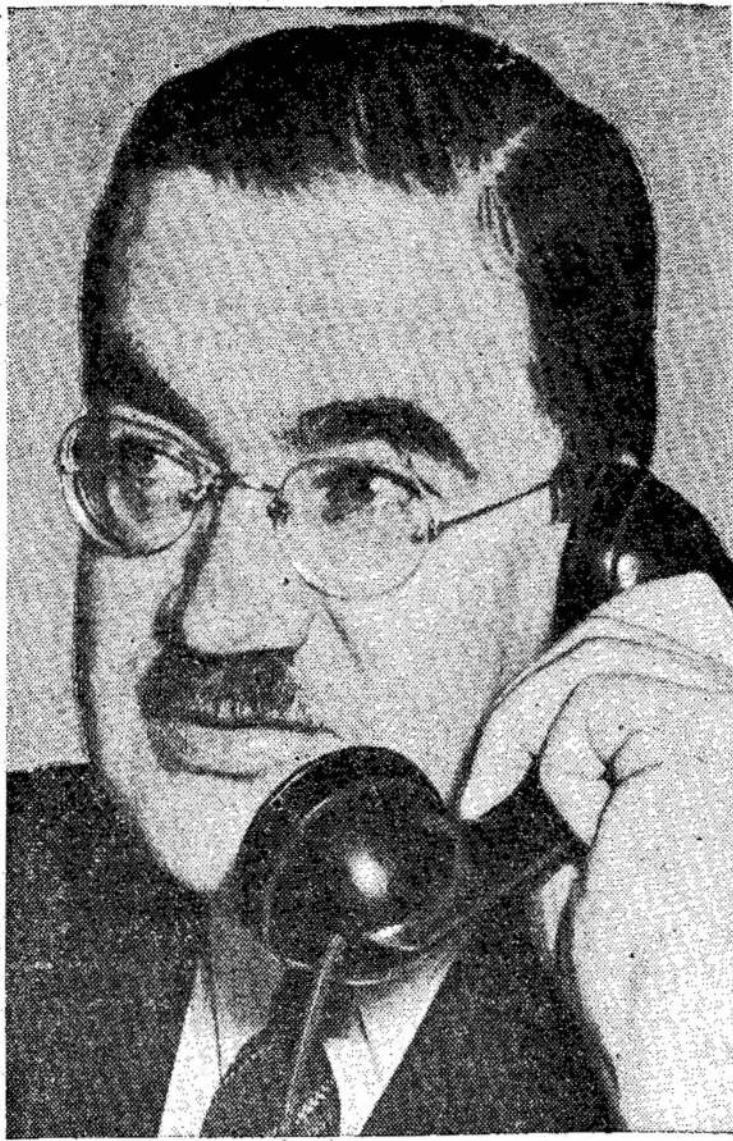
Donald Gordon, CNR gelžkeilių bosas, kuriam šiuo tarpu tenka nemažai rūpesčio, kadangi 135,000 gelžkeilių darbinčių dėl CNR ir CPR ruošiasi streikui.