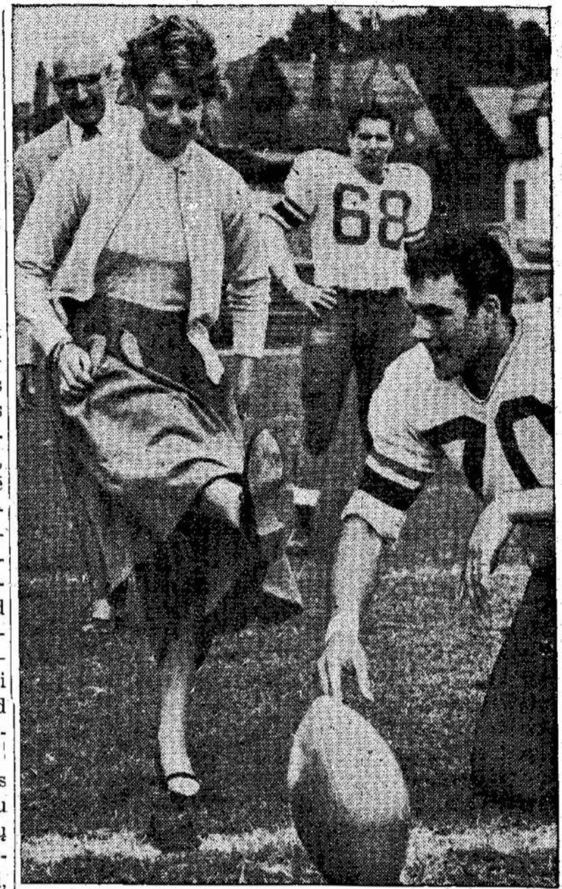
Marilyn Bell, apgalėjusi Ontarijos ežerą, spiria bolę pradedant "Keturių Didžiųjų" rungtynes Toronte. Ji dabar visur mielai laukiama. Net Hollywoodas panorą pasi-grobtį ją. Bet daug kas pata-dedant "Keturių Didžiųjų" ria jai pasilikti Kanadoje, kur jai taip pat yra daug progų.