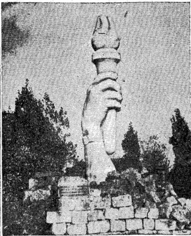
Francūzai turi pastatę tokį dienų. Jis vaizduoja taikos paminklą priminimui Lapkričio 11 (Remembrance) ranka su žibintu

Viena, tos "vadavimo" pastangos nueina veltui, sykiu su Kerstenais, padarius nemažus surinktu aukų išėik-