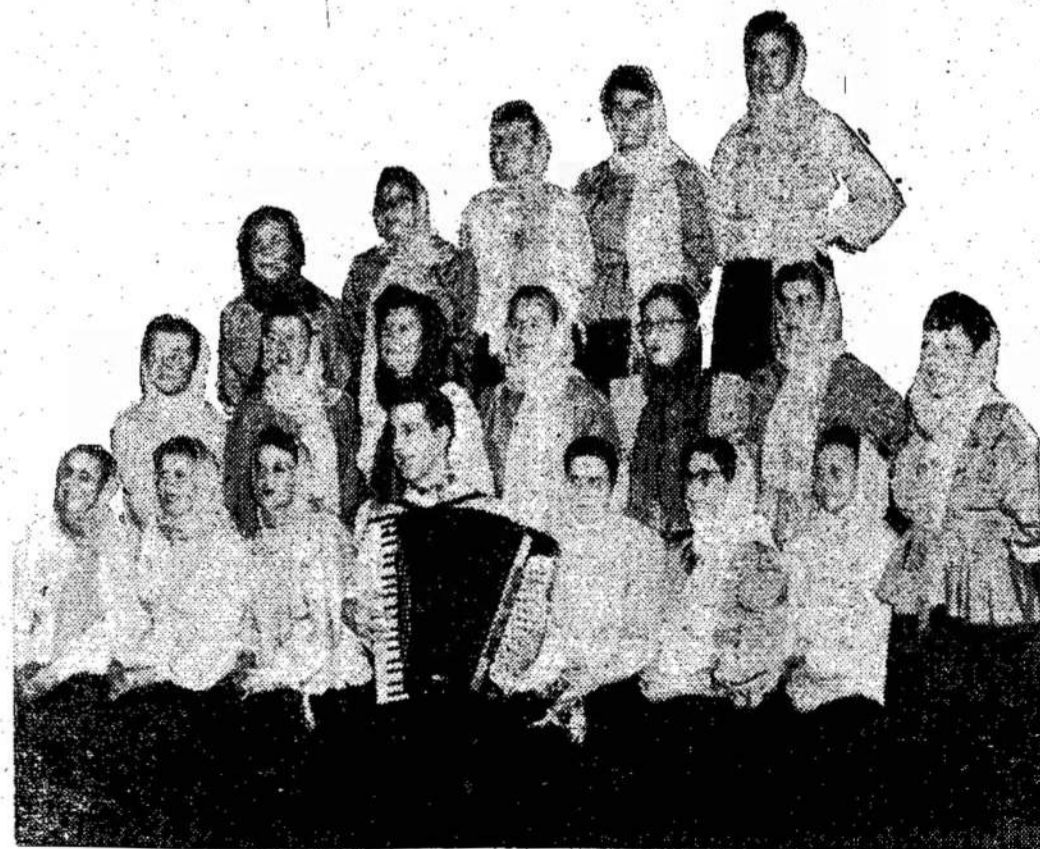
Rusų Moterų Choras, kuris pirmą kartą dainuos Liaudies Balso koncertiniame parengime, kuris įvyks šį šeštadienį, lapkričio 20 d., Christie Auditorium, 260 Christie St.

Pirm atvykimo į Kanadą, ji lankėsi Jungtinėse Valstijose.