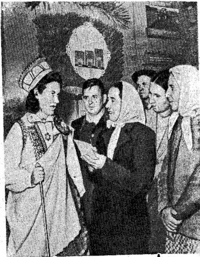
Latvijos paviljone visasą-ler kalbasi su kolektyvie- junginėje žemės ūkio paro- čiais iš Kirovogrado apylin- doje Maskvoj. Vedėja Mil- kės.

Lietuvos miestuose ir rajonų centruose statomos stambios maisto pramonės įmonės. Pradėtas statyti mėsos kombinatas Vilniuje. Čia bus per pamainą gaminama iki 10 tūkstančių kilogramų