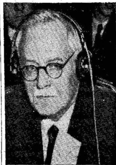
A. Y. Višinskis, Tarybų Sąjungos Jungtinių Tautų delegacijos galva, kurs pereitą savaitę mirė širdies ataka. Čia jis matomas laike JT-debatų. Pastaruoju laiku jis taipgi buvo vienu iš užsienio reikalų ministerio pavaduotojų.

Ar nepradės amerikiečiai po truputį blaivėti.