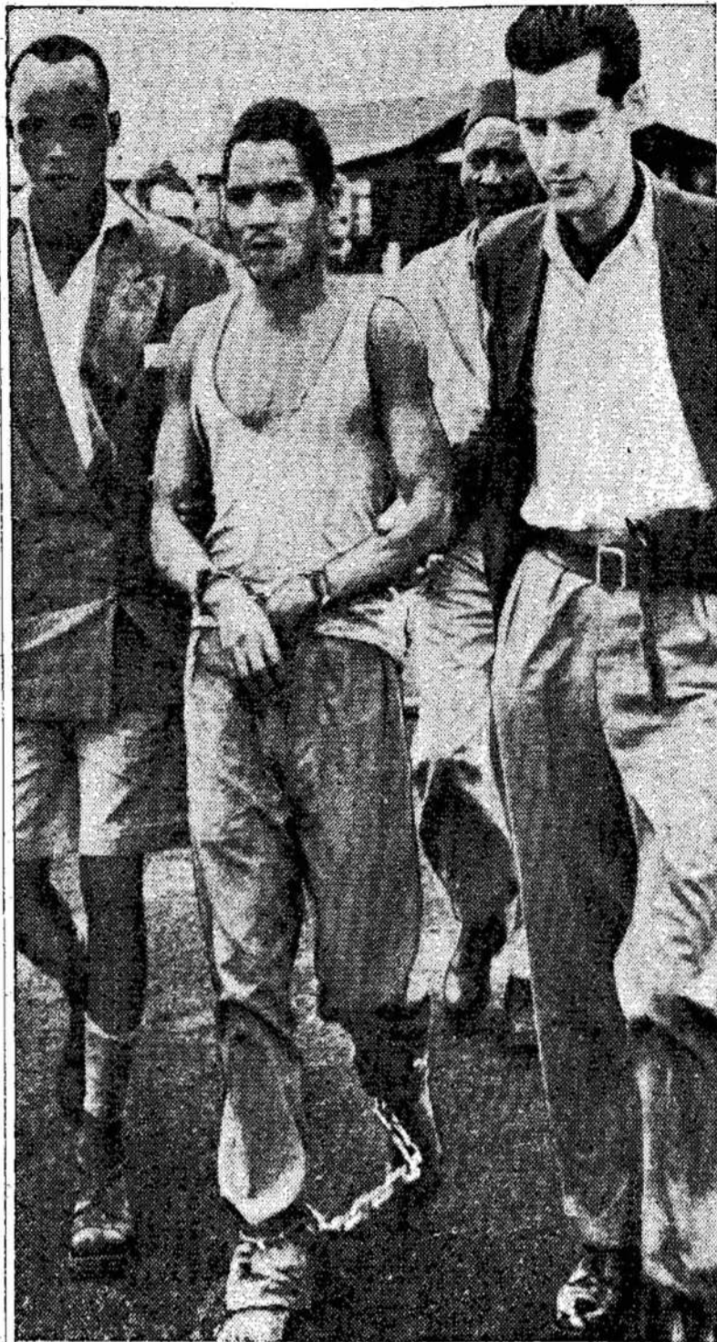
Vienas iš Kenjos kovotojų lonialė britų valdžia kaltina vadų, Kaleba, varomas iš tuos kovotojus prieš nepa- teismo rūmų, kur jis ir kiti keliamas sąlygas terorizme du buvo nuteisti miršin. Ko- ir medžioja po miškus

Užsienio Reikalų Ministe- rijos pritarimu voldemari- ninkų grupė minėtais moty- vais buvo laikas nuo laiko paremiama mažesnėmis fini- ginėmis sumomis (keliais šimtais markių), kad tuo bū- du būtų galima kontroliuoti jų veiklą ir tolimesnę plėt- rą. Parama ginklais, lėktu- vais ir automašinomis — ko- jie pakartotinai prašė — ne- buvo suteikta. Taip reiktų ir toliau daryti. Parama plates- nėje plotmėje galėtų būti