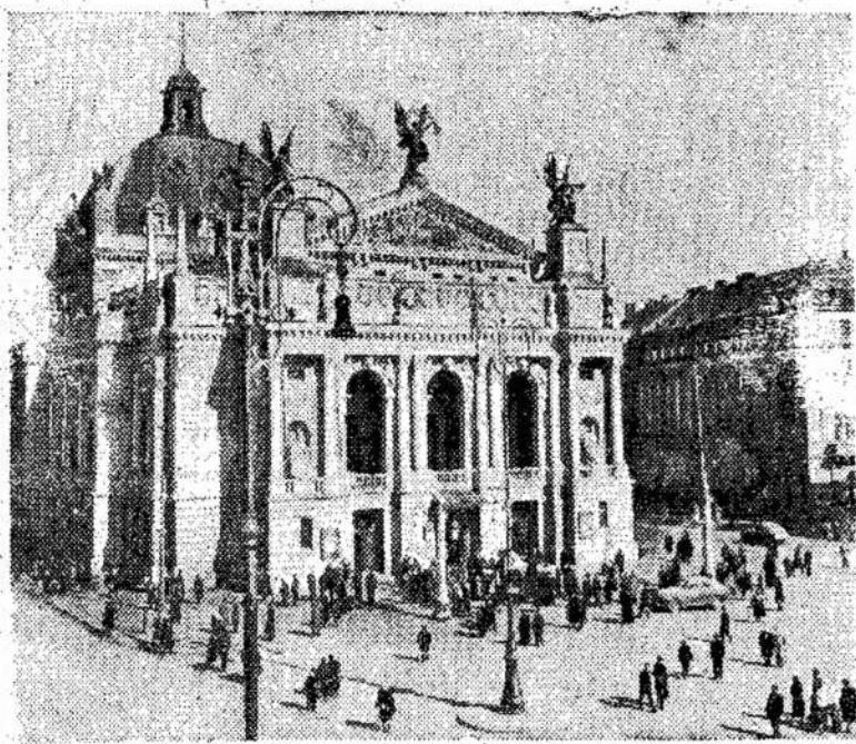
Lvovo Valstybinis Operos ir Baleto teatras.

Molotovas priduria, kad Tarybų Sąjungoje sutvirtėjo nuomonė, jog visomis šiomis bazėmis JAV nieko gero negali pasiekti nei jų pačių interesų požiūriu, nei taikos interesų požiūriu. Bet koks bešališkas žmogus negali sutikti su tuo, kad karinės bazės steigiamos daugelyje šalių ir, būtent, netoli kitos valstybės sienų JAV saugumo interesais. Jis, Molotovas , mano, kad tokių naivių žmonių nėra. Viso to negalima paaiškinti JAV saugumo interesais, nes jų saugumui niekas negrasina, o kai dėl Tarybų Sąjungos, tai ji, apšlamai, niekam, jokiai šaliai negrasina. Tarybų Sąjunga užsiėmusi savo vidaus reikalais, kurių ji turi pakankamai, ir, suprantama, suinteresuota taikos užtikrinimu, kaip tuo suinteresuotos ir kitos tautos. Kai dėl to, kad Amerikos karinių bazių steigimas nerodo nedraugiškos pažiūros į TSRS, tai jai galima pasakyti štai ką: santykiams tarp mūsų šalių pagerinti daugeliu atvejų padėtų šių bazių likvidavimas ir perėjimas prie padėties, kuri paprastai egzistuoja tarp valstybių, palaikan-