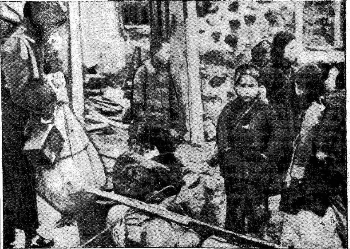
Viena iš Tacheno salų šeimų pasirengusi evakuotis. Nacionalistai išsivare visus, išskyrus keletą, kuriems pavyko pasislėpti. Pašs Čiang Kai-šeko sūnus, kurs vadovauja įvairioms policijoms, buvo nuvykęs prižiūrėti, kad niekas nepaliktu.

Šitokios tragedijos niekas iš anksto nenusakys. O esti širdžių, su visokiais trūkumais bei ydomis, peraugusių, išpurtusių, o vis dėlto jos patvariai, kad ir netaip ritmingai, eina ir eina savo gyveninę pareigą. Svarbiausia tokiam žmogui nesigrauzt be reikalo, negyvent po baimės ir nerimo rimbu. Būk viltingas ir ramus, dirbinėk nuosaikiai, tik neperdėdamas, tai kad ir silpna širdis tarnaus tau patvariai metų metus. Dėmėkis gyvenimo eiga, neatitrūk nuo gyvenimo, būk jo kovų dalyvis, tai ir pagyvinsi ilgiau ir naudingiau.