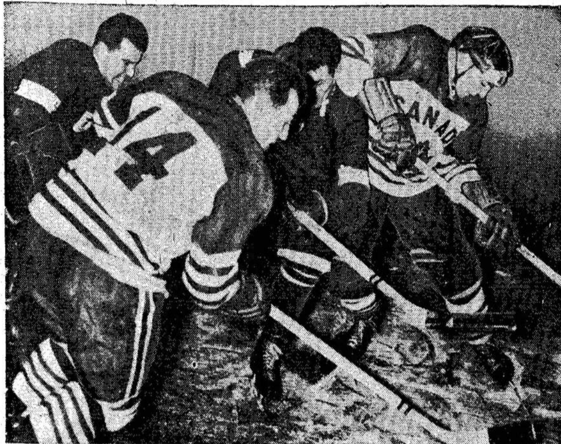
Kanados ir Vokietijos hokej žaidėjai laike žaidynių Berlyne. Kanadiečiai nugalėjo vokiečius 11-4. Vėliau kanadiečiai žaidė Čekoslovakijoje, kur jie laimėjo 5-3. Čekoslovakai kaltino kanadiečius žiaurumu. Vėliau kanadiečiai žais su rusais.