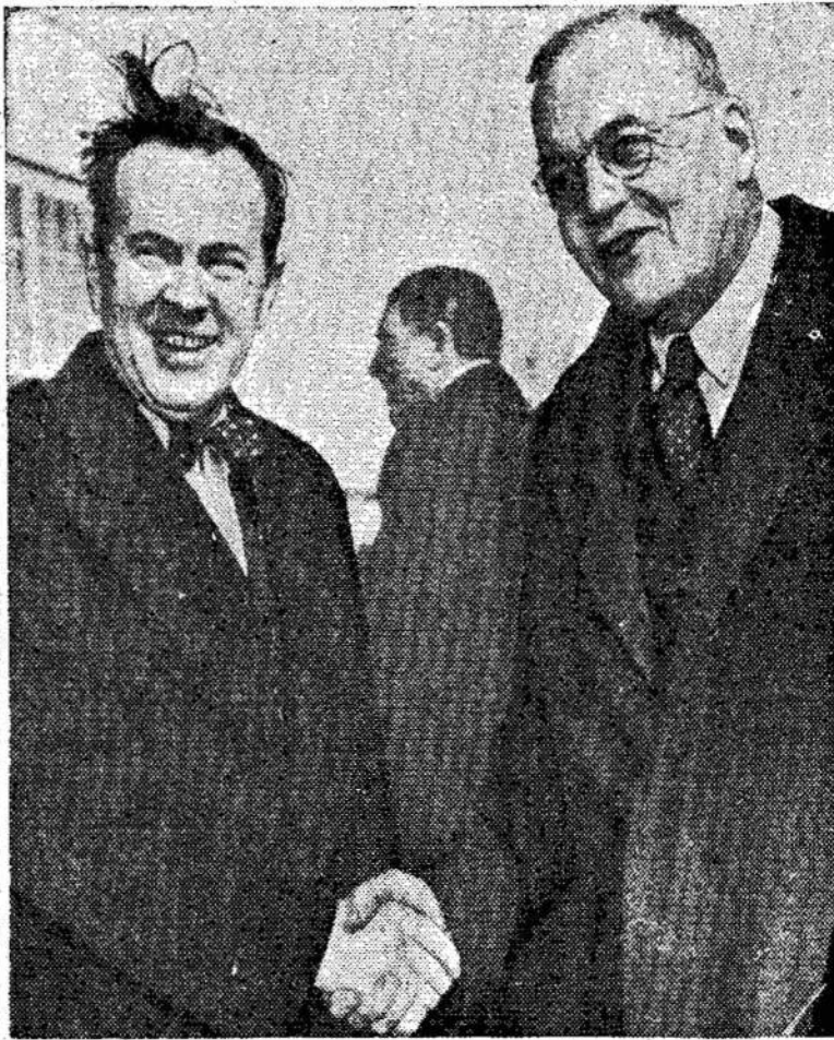
Kanados užsienio reikalų ministeris Pearsonas ir Jungtinių Valstijų valstybės sekretorius Dulles. Ponas Dulles lankėsi Ottawoj, matomai tikslu apraminti Kanados vyriausybės nepasitenkinimą prekybos klausimuos.

Tai tik pora pavyzdžių, kurie parodo, kaip reagavo