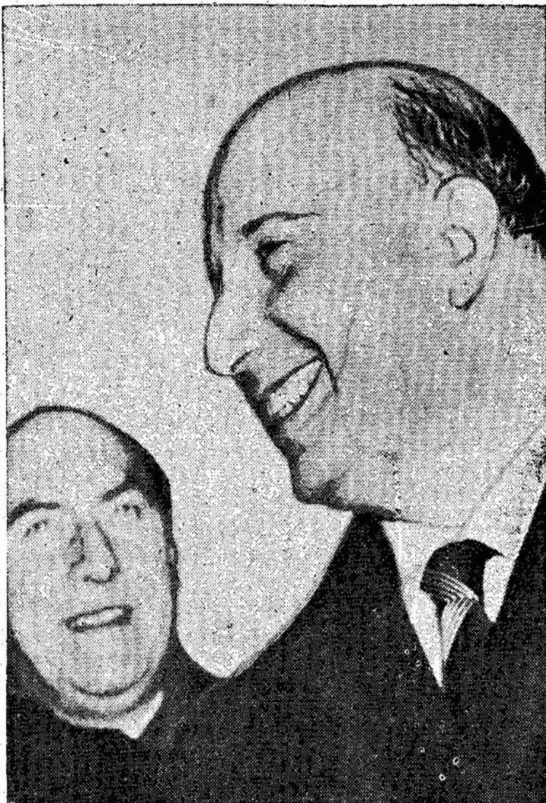
Italijos premjeras Mario Scelba, kuris lankėsi Kanadoje, o vėliau Washingtonė. Italija, kaip žinia, yra NATO narė ir pasisakė už vokiečių ginklavimą.

Ar tas nestato klausimo: Ar ne laikas žmogui pagalvoti, kur einama? Kas iš to bus? Ar nebūtų geriau, kad