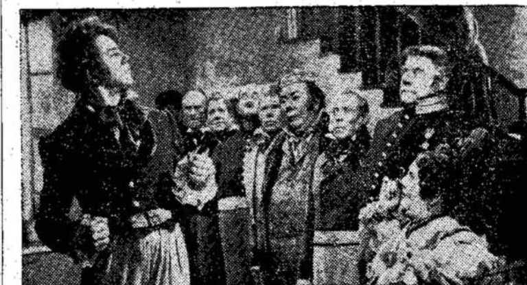
Scena iš tarybinės filmo "Generalis Inspektoriaus", kuri bus rodoma LaSalle teatre, ant Dundas netoli Spadina. Filma pagaminta pagal

Užsieniniai stebėtojai čionai pastebėjo, kad Egiptas krypta prie Indijos neutralumo. Egiptas taip pat esąs priešingas militariniams blokams, ypač pastangoms įtraukti arabiškas šalis į Vakarų militarinį bloką.