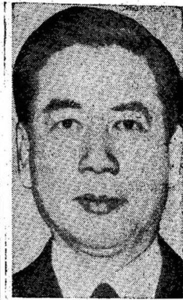
Pietinio Vietnamo premjeras Ngo Dinh Diem, prieš kurio valdžią kyla religinių sektų vadai, turį savo armijas, policiją. Diem'ą palaiko amerikiečiai.