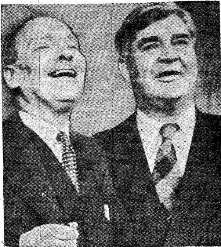
C. Attlee ir A. Bevan po to, ar jiems pavyks nugalėti kai jie susitakė. Jie smarkiai akėja konservatus, bet juos per rinkimus, tai parodys daviniai šį penktadienį.

Ir kaip gi ne. Jų kerštas ir neapykanta taip ir liks neišlietas! Poniškas unaras, poniškas kaprizas, liks gyvenimo sulamdytas. Degantį krūtinėje kerštą ir neapykantą, taip ir teks jiems nusinešti pas graborių, o šis nuves