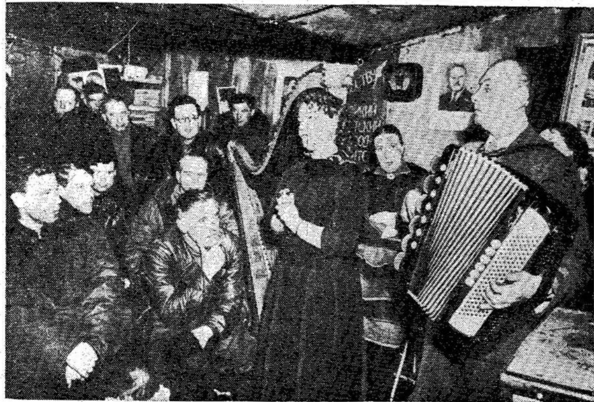
Arktike, kur nors netoli šiaurės ašigalio, randasi grupė tarybinių mokslininkų, kurie

BERLYNAS. — Raudonasis Kryžius sako, kad Sovietai išlaisvino ir gražino Votkietijon 30 karo kriminalistų, tarp jų 10 moterų.