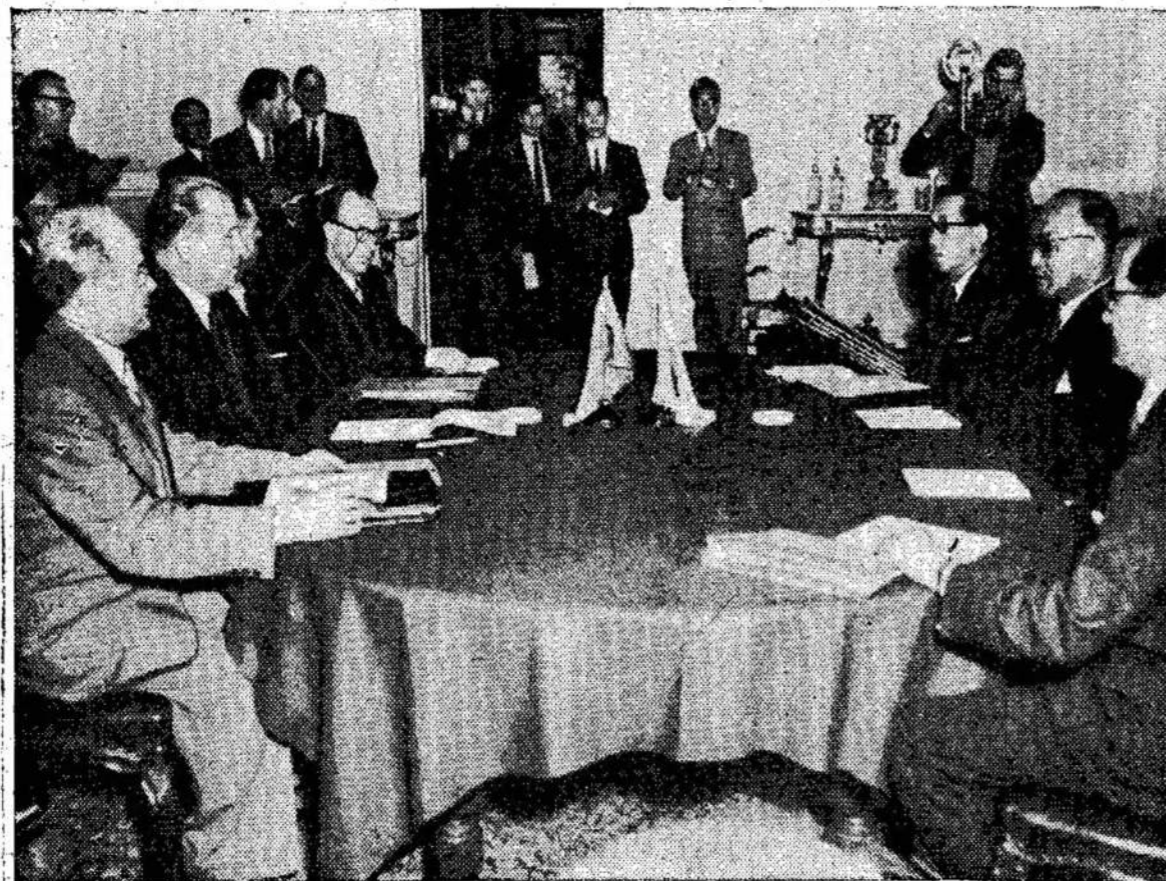
Tarybų Sąjungos ir Japonijos delegacijos prie apskrito stalo Londone. Jos tariasi tikslu normalizuoti abiejų šalių santykius, kurie buvo pakrikę iš karo priežasties. TSRS delegatai kairėj, o Japonijos — dešinė. Viduryje — žurnalistai.